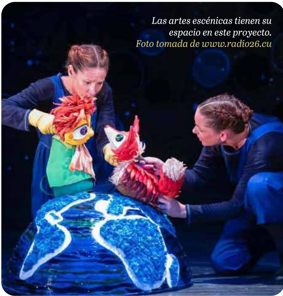
Las artes escénicas tienen su espacio en este proyecto.