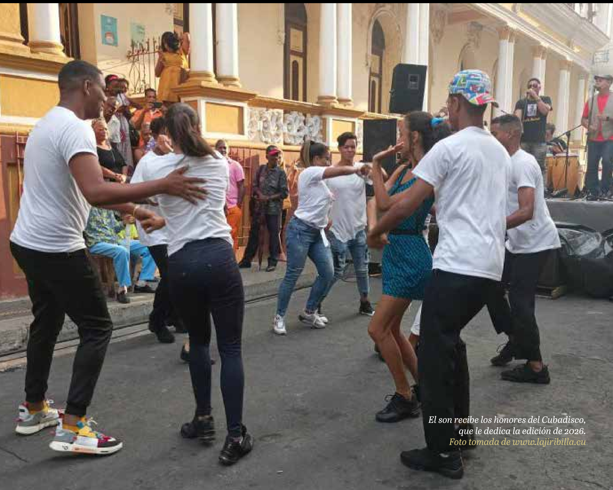
El son recibe los honores del Cubadisco, que le dedica la edición de 2026.

En sus propias palabras, lo más importante no es la entrega del premio, sino que dicho reconocimiento sea «ese referente de calidad auténtico» que contribuya a formar público y a visibilizar, una vez más, la vitalidad de la música cubana.