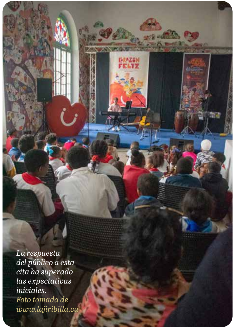
La respuesta del público a esta cita ha superado las expectativas iniciales.

«El objetivo se cumple cada vez que un niño descubre una emoción nueva y lo vemos salir con el corazón feliz».