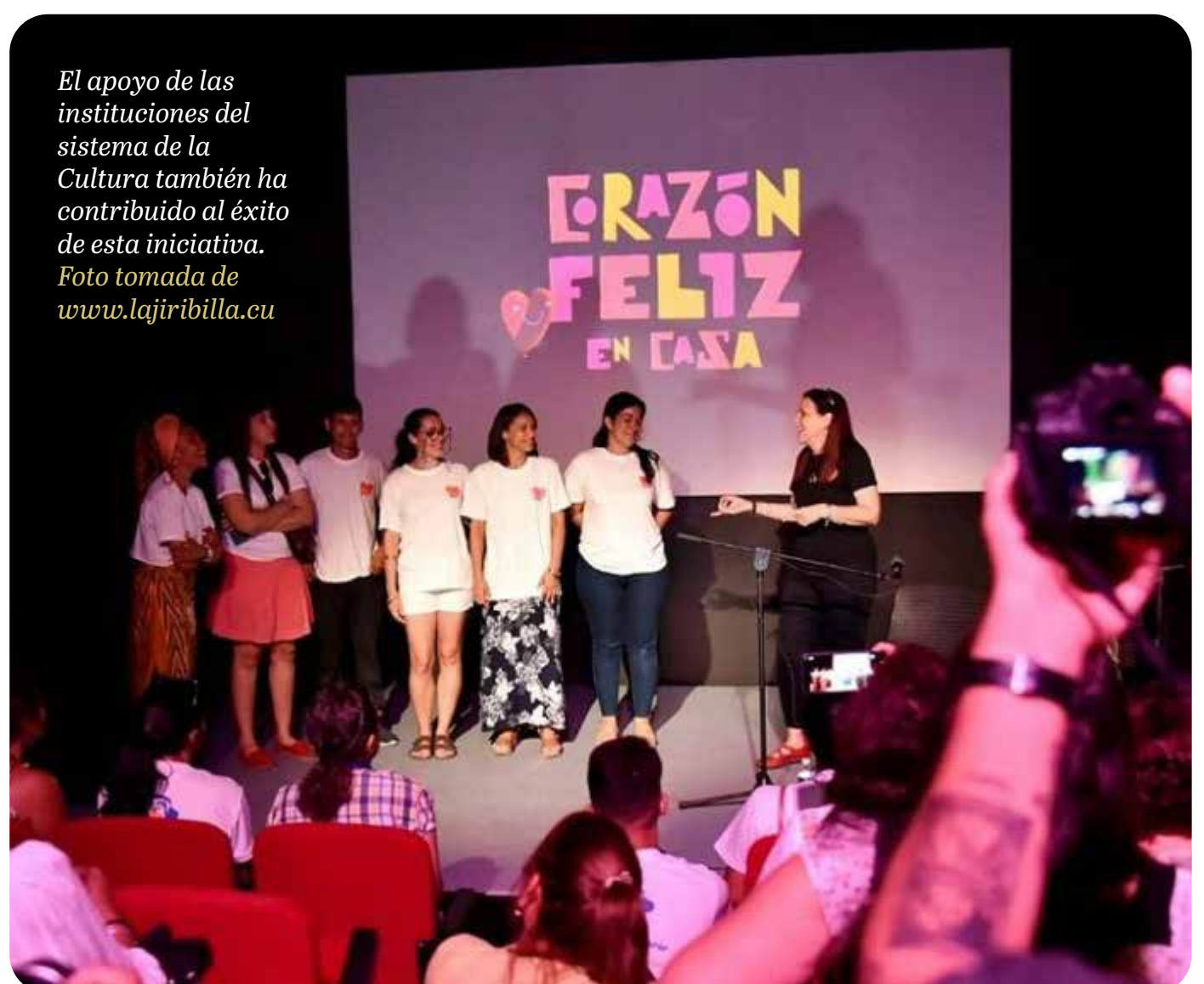
El apoyo de las instituciones del sistema de la Cultura también ha contribuido al éxito de esta iniciativa.

Con el fin de sortear los obstáculos derivados de la crisis energética y de combustible en el