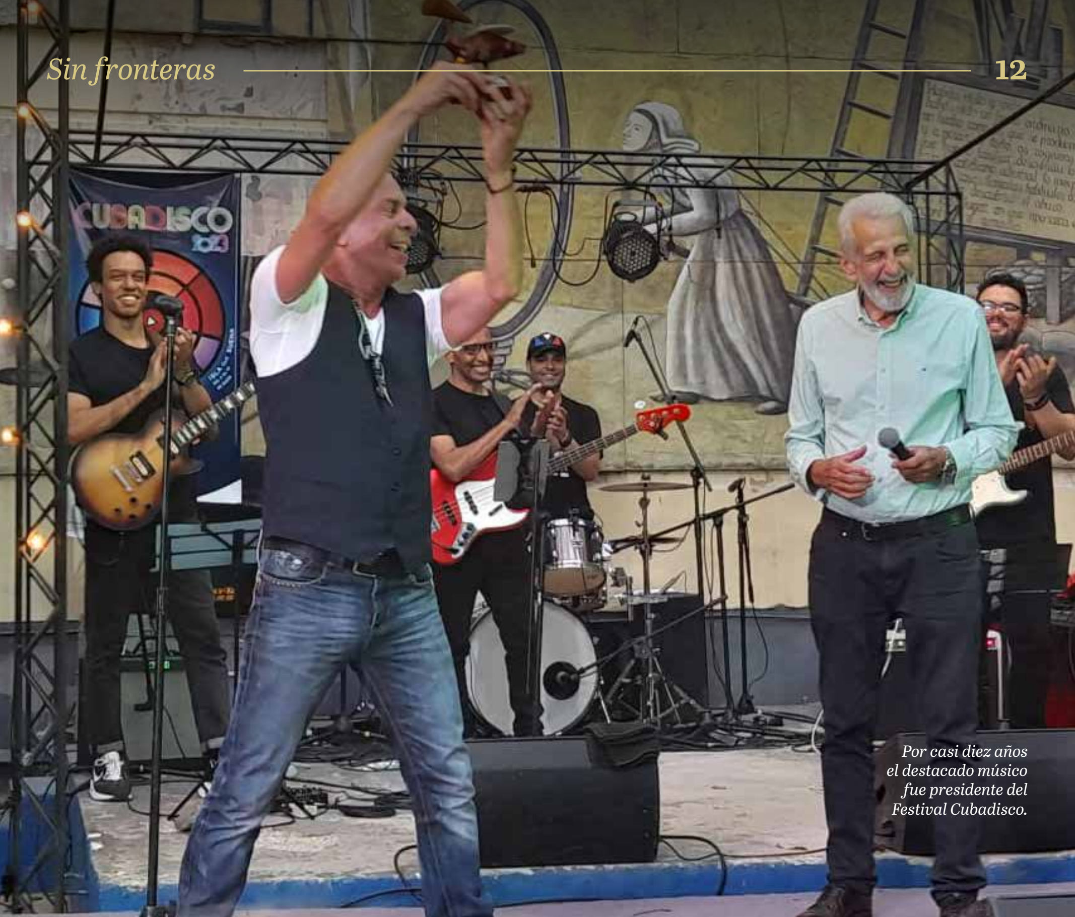
Por casi diez años el destacado músico fue presidente del Festival Cubadisco.