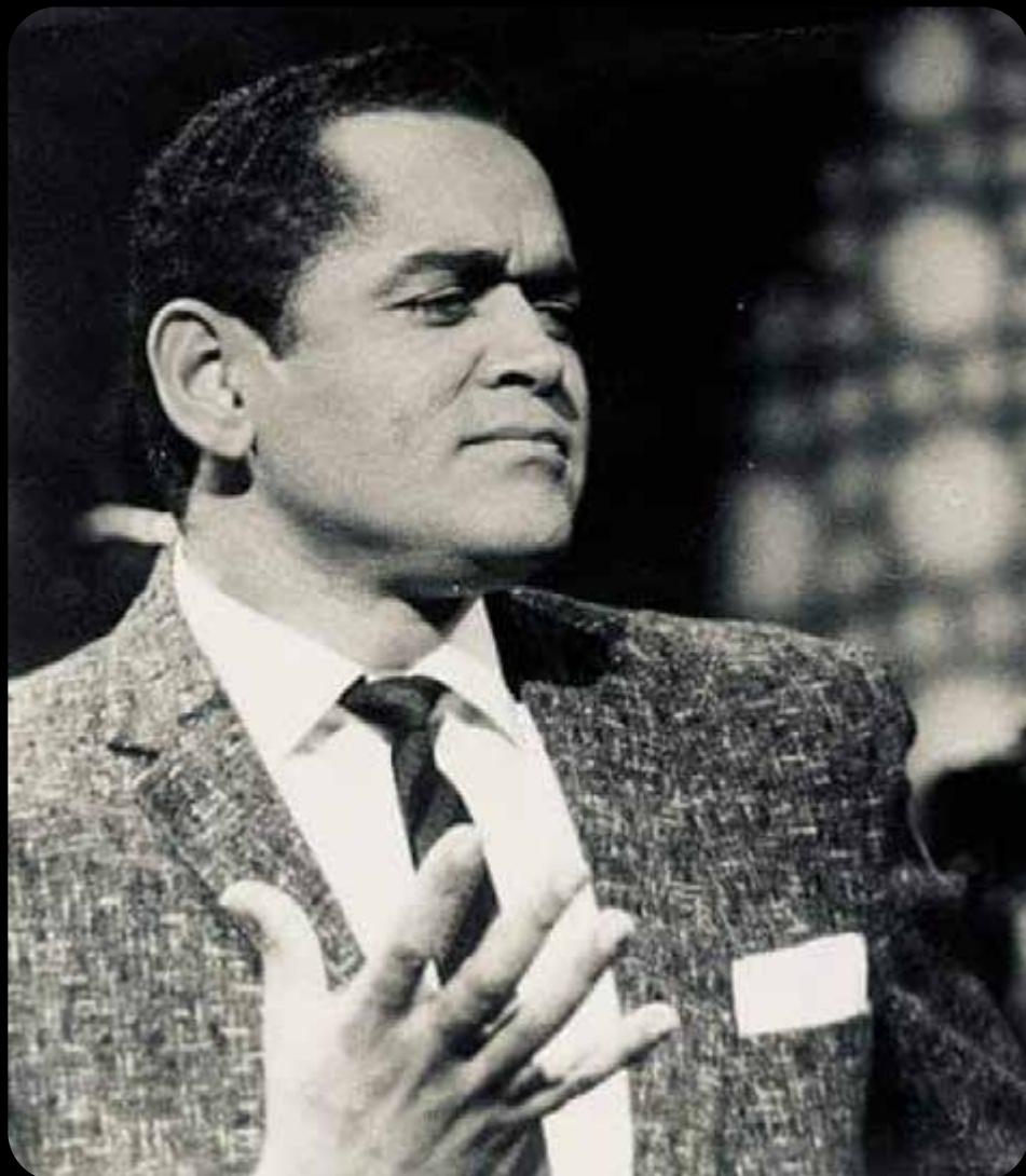
El centenario del cantante Pachito Alonso también será recordado en la fiesta del disco cubano.

El festival también honrará los 70 años de la orquesta Revé y el centenario del cantante Pachito Alonso, otro grande de la música nacional. Será un ensayo de adaptación: ante la crítica situación energética del país, se adelantarán horarios, se reducirán espacios y se priorizará que el público pueda acceder a las actividades.