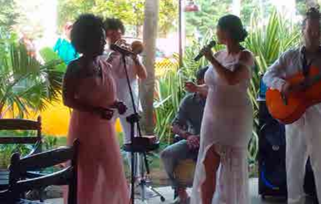
La canchánchara ofrece a sus visitantes la posibilidad de degustar este emblemático trago, elaborado con ingredientes locales, en un ambiente auténtico y acogedor.