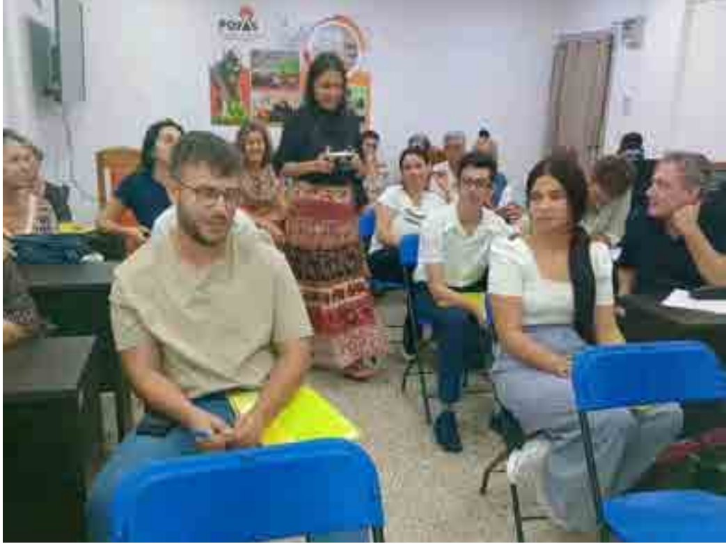
El encuentro contó con la participación de funcionarios del Grupo Empresarial Agroforestal y estudiantes de la carrera de Ciencias de la Información.

El programa incluyó el componente energético, presente en el proyecto Línea Verde, Comunidades de energías renovables y seguridad alimentaria.