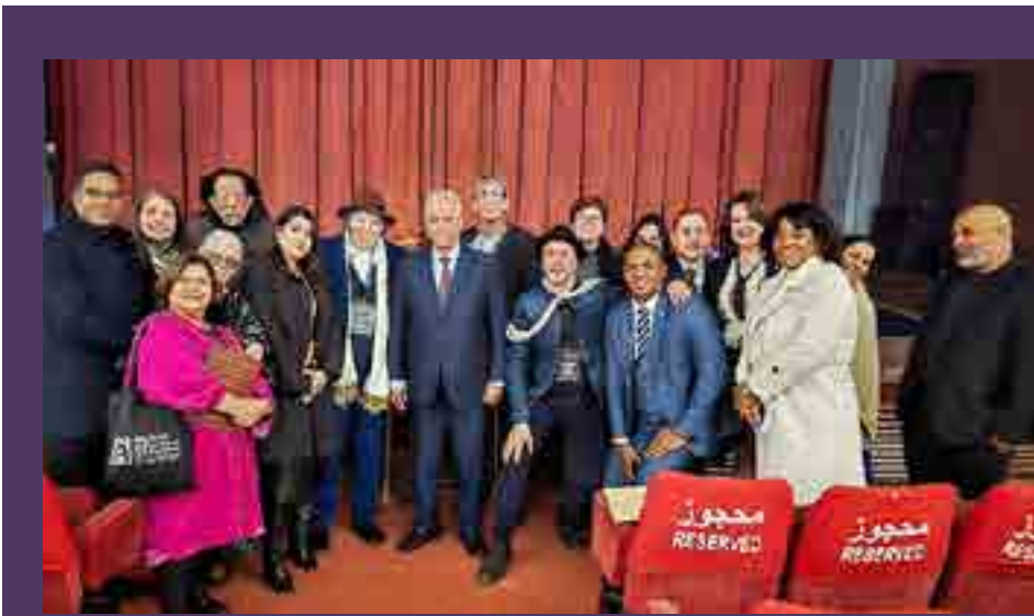
El evento constituyó un verdadero cruce de caminos culturales entre pueblos, donde el cine se afirmó como una herramienta para la memoria, la resistencia y la imaginación.

El diplomático agradeció a las autoridades culturales argelinas, al comité organizador y al Instituto Cubano del Arte e Industria Cinematográficos (ICAIC) por la cálida acogida, en una edición considerada memorable por sus participantes. ≡