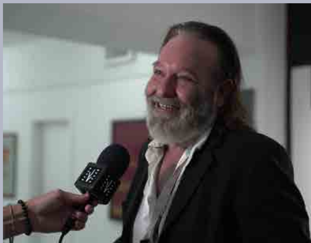
Destacado actor y realizador Jorge Perugorría.

Durante la adolescencia, Iluminada abandonó su hogar en el campo para viajar a la capital en busca del sueño de convertirse