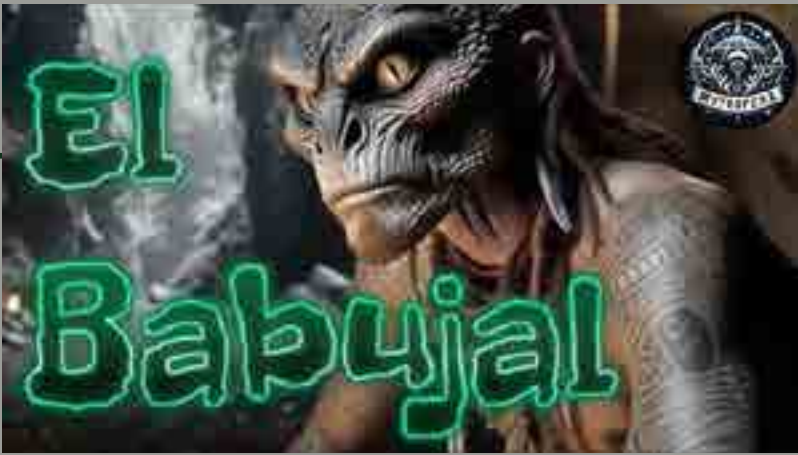
El Güije, el Babujal y la Madre de Aguas son, en realidad, páginas muy ilustrativas de una literatura oral que sigue tragándose el tiempo para regalarnos moralejas... y muchos sustos.

Muchas personas creen que este ser es real y, para protegerse, se hacen tatuajes religiosos o portan amuletos de oro, plata, hueso o conchas.