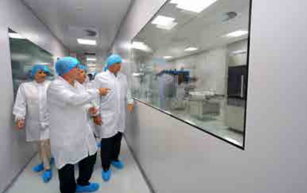
Genfarma, una empresa mixta para satisfacer necesidades de medicamentos de los pueblos cubano y vietnamita.