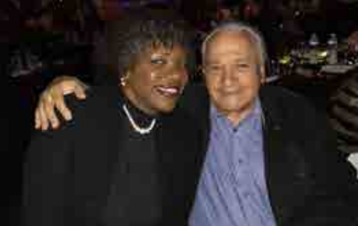
Zulema junto a Frank Fernández, Premio Nacional de Música.