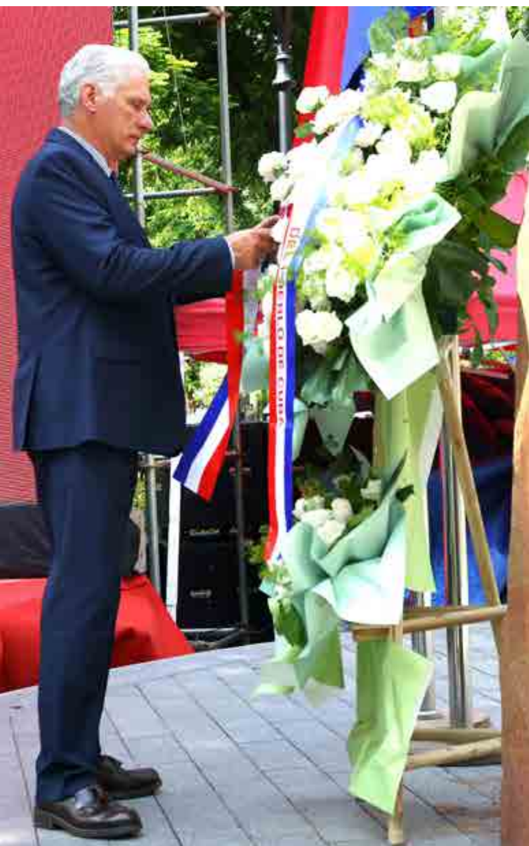
El mandatario llevó flores blancas en homenaje al Apóstol, quien simboliza los lazos históricos entre cubanos y vietnamitas.

A su arribo a la capital vietnamita, el mandatario cubano rindió homenaje al Héroe Nacional José Martí con la colocación de una ofrenda floral ante el busto que perpetúa su memoria en el parque-jardín Tao Dao. ≡