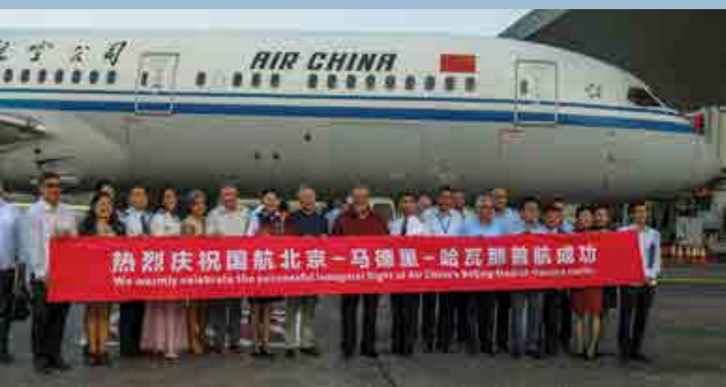
La reanudación de la conexión aérea entre Beijing y La Habana, a través de la aerolínea Air China, debe contribuir al aumento de los turistas provenientes del gigante asiático.

La edición 43 de FITCuba 2025, una de las mayores de su tipo en el Caribe, está prevista a celebrarse del 30 de abril al 3 de mayo próximos. ≡