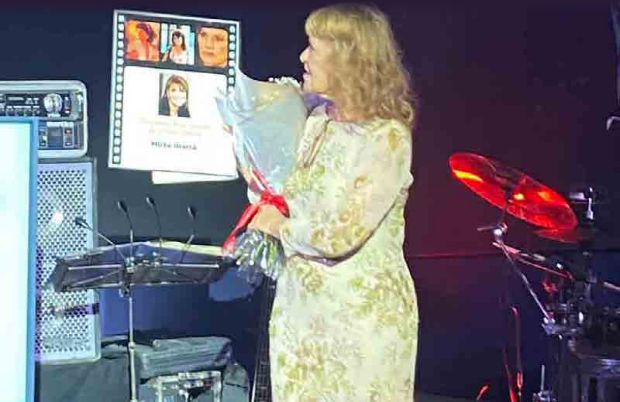
La actriz, uno de los rostros reconocibles del séptimo arte cubano, recibió el Premio Nacional de Cine 2025.