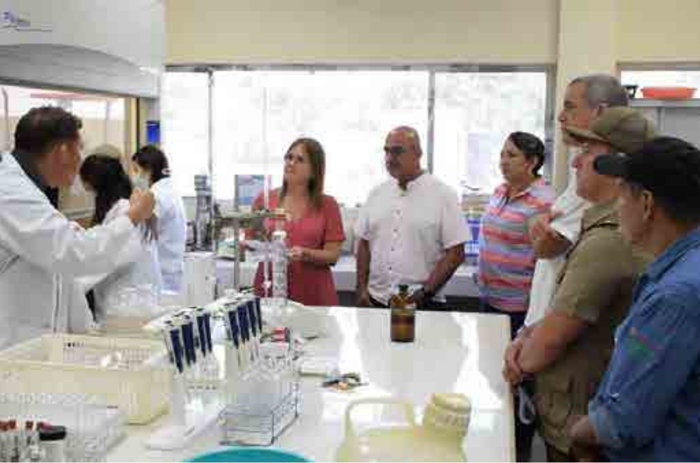
La diplomática, junto a otros miembros de la misión antillana, visitó el laboratorio especializado en suelo y agua, cuyas investigaciones han ayudado a ampliar las cosechas de los productores locales.

función del posicionamiento de las utilidades de la moringa, de la producción y necesidades de garantizar la soberanía alimentaria”, expresó la diplomática.