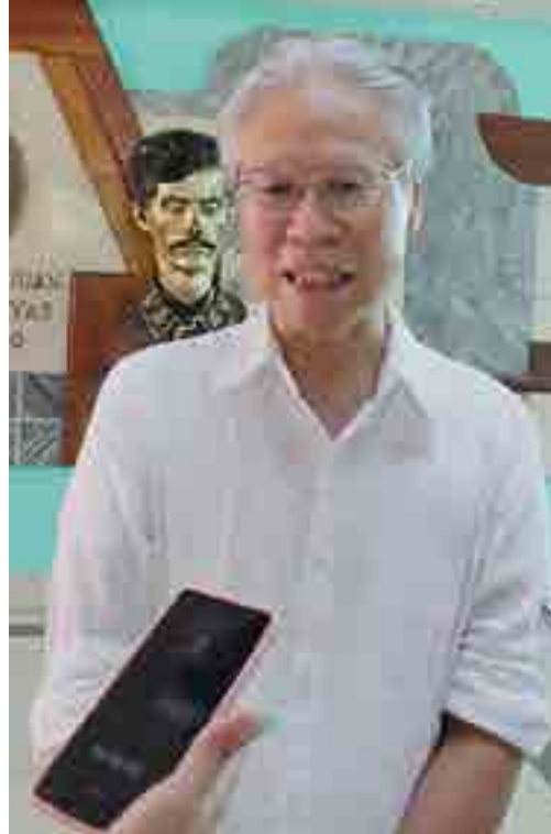
El embajador japonés Nakamura Kazuhito expresó su deseo de que este proyecto contribuya a mejorar la atención a lactantes y recién nacidos.

De acuerdo con el galeno, las contribuciones refuerzan el compromiso con las metas propuestas y el Programa de Atención Materno Infantil, en tanto inspira a desempeñarse con mayor dedicación y esfuerzo. ≡