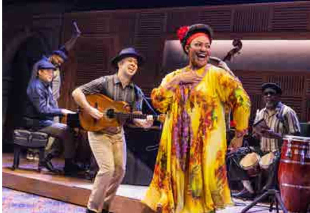
Desde Ámsterdam y Barcelona hasta Nueva Jersey, músicos y actores de todo el mundo acudieron para participar en esta singular celebración de la cultura cubana.

Entre las grandes estrellas del Buena Vista Social Club figuran nombres como Compay Segundo, Ibrahim Ferrer, Omara Portuondo, Eliades Ochoa y Rubén González Fontanills, entre otras que ya contaban con gran trayectoria musical y muchos años de vida antes de disfrutar de este enorme reconocimiento mundial. ≡