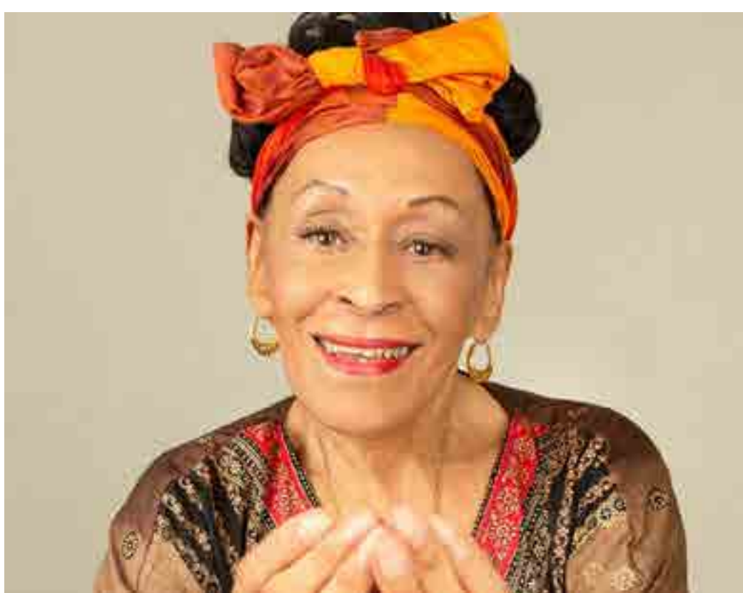
La diva de la afamada agrupación, Omara Portuondo, valoró el espectáculo como un regalo anticipado por su 95 cumpleaños.