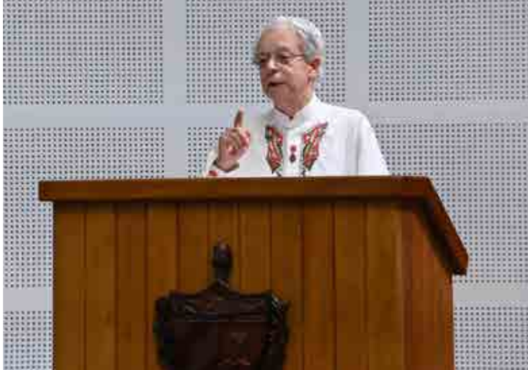
El intelectual brasileño Frei Betto abogó por una política que acerque los gobiernos a los ciudadanos, a la unidad de los pueblos, a apartar las luchas internas que generen divisiones.

En él, el sumo pontífice expresó que “la esperanza se revela como un valor muy