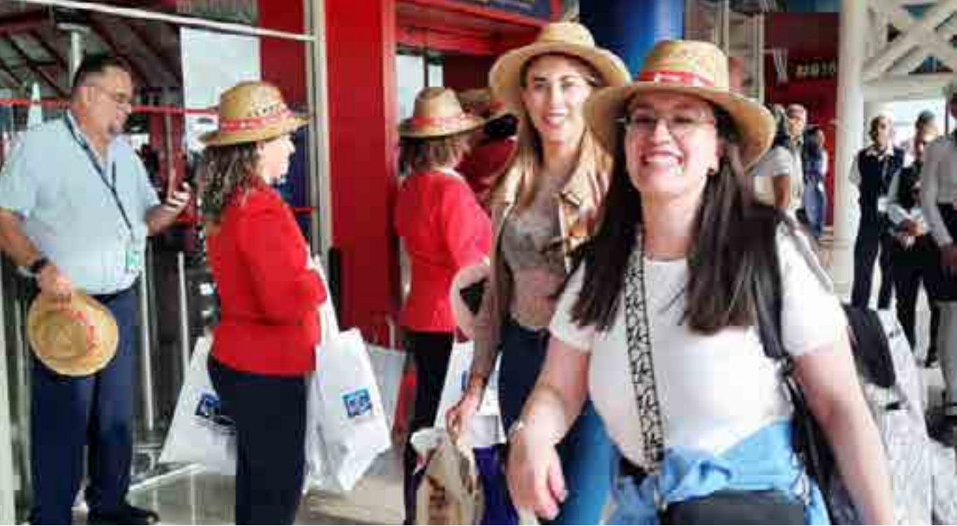
La Feria Internacional de Turismo (FITCuba) tendrá lugar en La Habana del 1 al 5 de mayo próximo y estará dedicada a China.