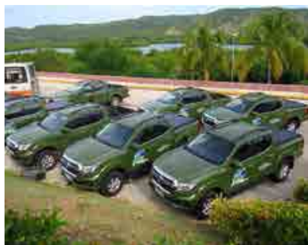
Como novedad se renovó la flota de vehículos terrestres para potenciar el turismo de naturaleza, aventuras y ruralidades.

Perú (25), China (48), Türkiye (12) y Portugal (20).