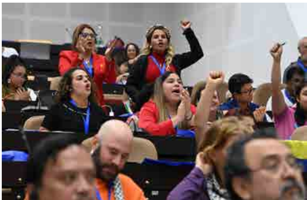
Un momento especial del foro llegó cuando los delegados recibieron el mensaje del papa Francisco, quien los llamó a cultivar la esperanza para poner fin a la lógica de la violencia y los conflictos que tanto sufrimiento generan en el mundo.

adecuado para este foro que celebran en La Habana, pues, gracias a su aspiración de ser abierto, plural y multidisciplinar, tiene la capacidad de asomarse a las razones que mueven el corazón del hombre de hoy”.