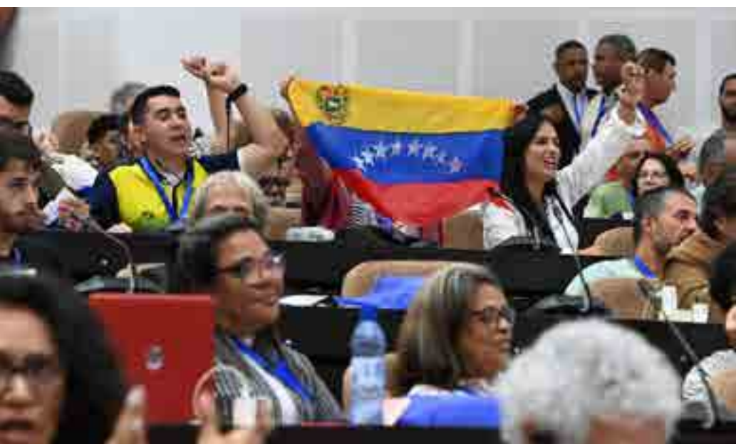
Al evento, inaugurado en el Palacio de Convenciones, asistieron más de 600 delegados de 98 países y 400 cubanos.