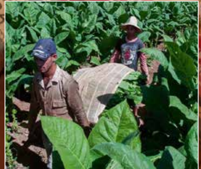
Hay cuatro factores que hacen al tabaco cubano único en el mundo: los suelos y el clima de la isla, la variedad de cultivos, y el conocimiento de vegueros y torcedores transmitido por generaciones.