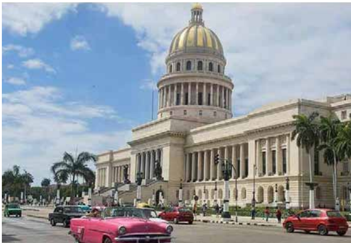
A pesar de un grupo de factores exógenos negativos a partir de septiembre de 2017, ese año cerró con 4 689 000 visitantes.