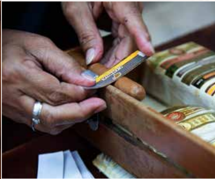
Los puros Premium o hechos a mano tienen medidas de distinción para protegerlos de falsificaciones y fraudes.

Al tener dichos elementos a la mano se puede afirmar que los habanos mantienen su corona de los Mejores Premium del mundo, colocada sobre esta isla por millones de fumadores. ■