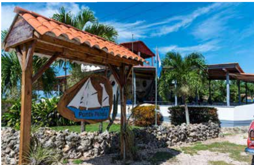
Este destino ofrece la posibilidad de bucear desde la costa.