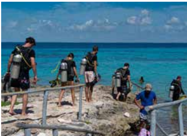
Muchos visitantes extranjeros prefieren dicho lugar.