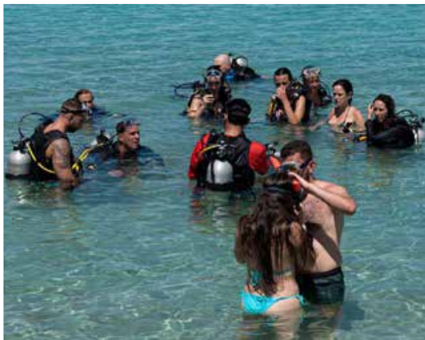
Posee una gran belleza y abundancia de especies de corales.