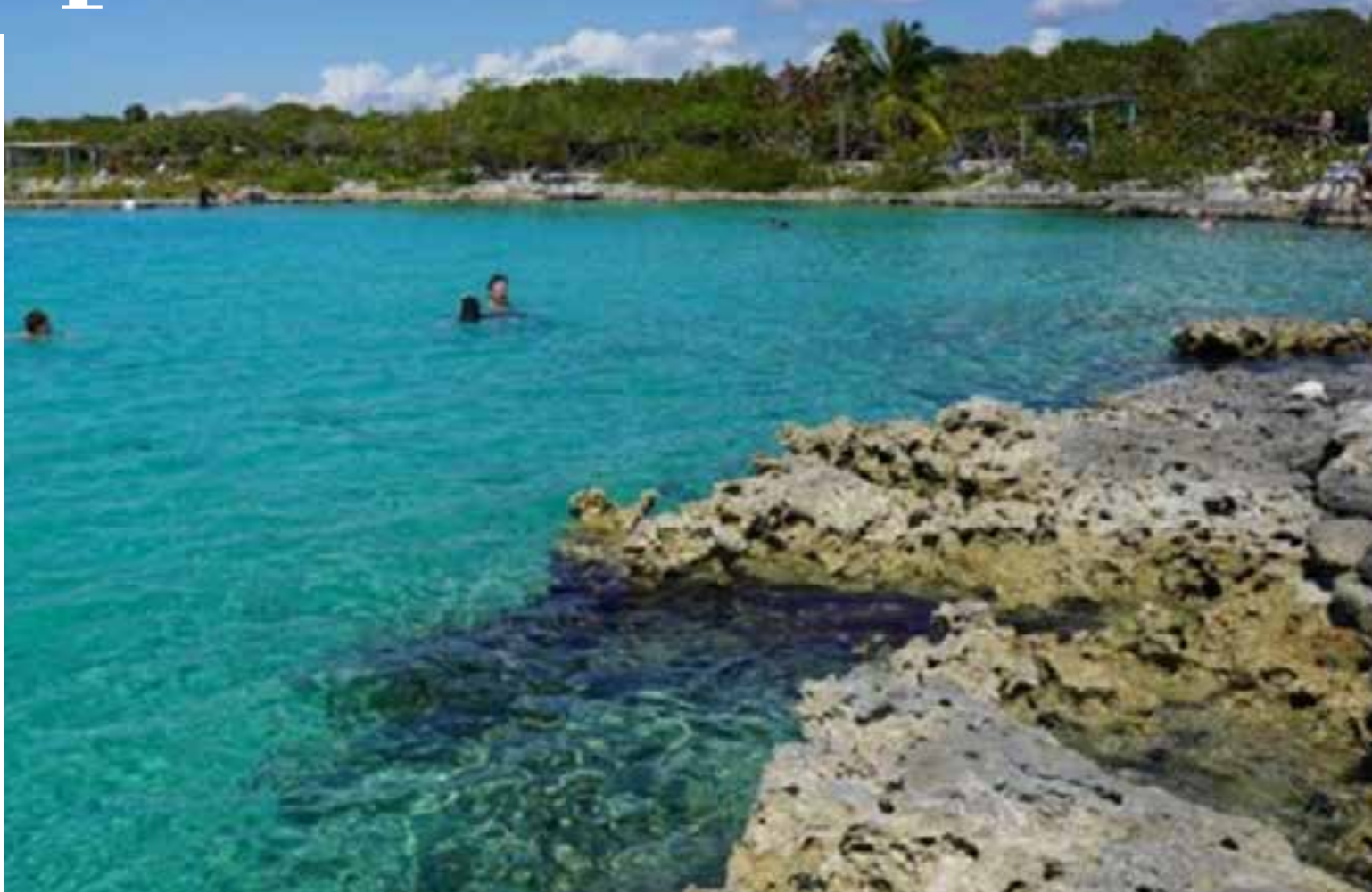
Este sitio está ubicado en la Ciénaga de Zapata, el humedal más importante del Caribe insular.

El mar otorga al viajero una belleza particular, entretenimiento y aprendizaje. Esas propuestas tienen variados escenarios en este país, algunos muy conocidos, otros por descubrir. ■