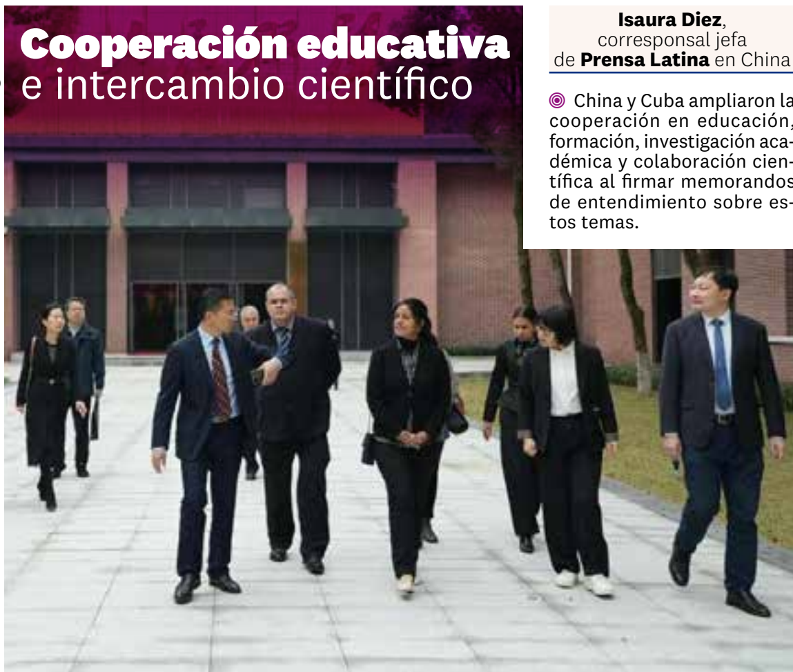
Con la firma de memorandos de entendimiento Cuba y China fortalecen la colaboración bilateral.

Organizado por el Ministerio de Comercio, el Seminario de Gestión de la Administración Pública para los Países de América Latina se desarrolló en el Instituto Vocacional de Comercio Exterior de la provincia de Hunan con la presencia de varios expertos latinoamericanos, entre ellos, cuatro participantes de Cuba. ■