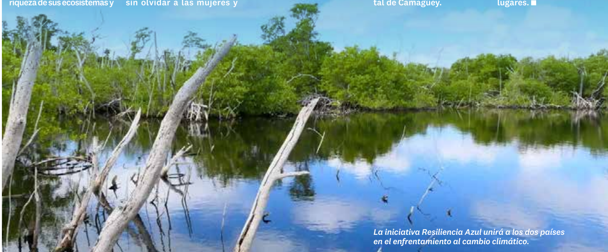
La iniciativa Resiliencia Azul unirá a los dos países en el enfrentamiento al cambio climático.

Asimismo, se elaborará una guía técnica y estudios de caso, y se participará en eventos a nivel nacional, regional e internacional para presentar los resultados y experiencias de las medidas de adaptación al cambio climático implementadas en ambos lugares. ■