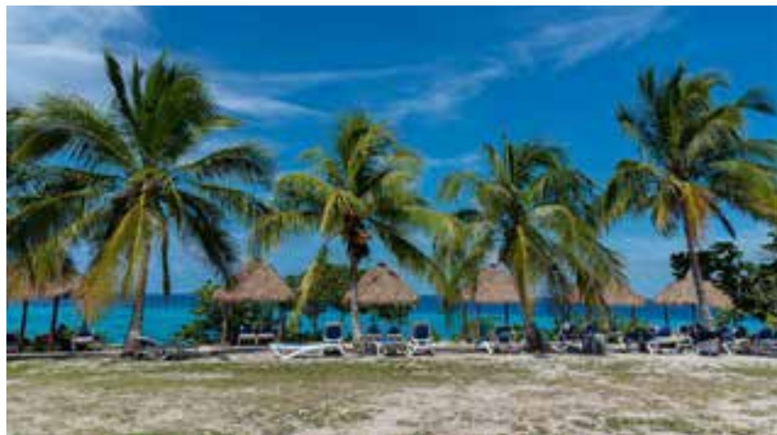
La isla cuenta con muchos puntos marinos de renombre.