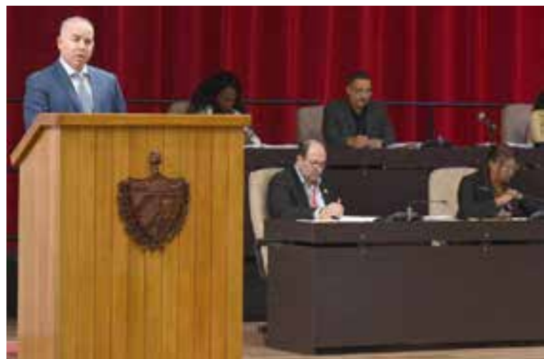
El titular de Finanzas y Precios, Vladimir Regueiro, destacó la importancia del fortalecimiento del sistema tributario.

Regueiro informó que se estimaron ingresos totales por 389 543 millones de pesos, cifra que representa el 107 por ciento de lo planificado, para un sobrecumplimiento de 25 169 millones de pesos. ■