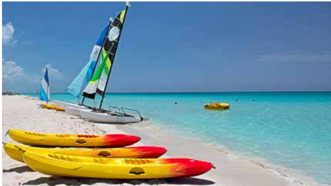
En 2019 y 2020 la nación caribeña sufrió los mayores impactos en el turismo por las sanciones y limitaciones impuestas por el Gobierno estadounidense.

A partir del segundo año de su primer mandato, Trump impulsó un endurecimiento radical de las sanciones contra la isla, más de 240 medidas, que incluyeron, en junio de 2019, la prohibición de los viajes en cruceros desde Estados Unidos, entre otras.