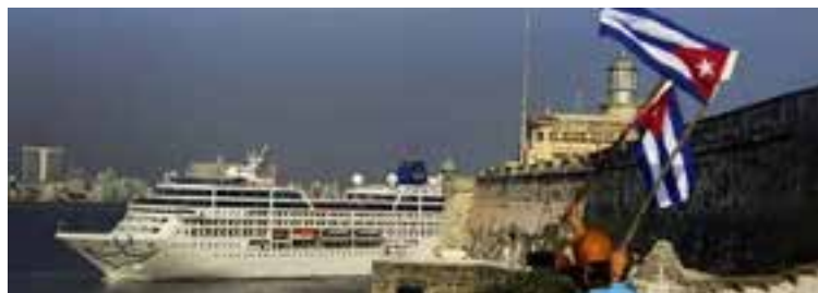
Donald Trump impulsó un endurecimiento radical de las sanciones contra la isla, más de 240 medidas, que incluyeron, en junio de 2019, la prohibición de los viajes en cruceros desde Estados Unidos.

En ese escenario, el transporte aéreo entre Cuba y la nación vecina en 2018 tuvo una contracción de 18,3 por ciento con respecto al año anterior; en total se realizaron 11 704 vuelos, unos 2 620 menos que en 2017.