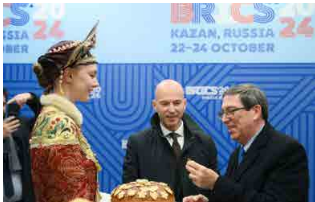
El 1 de enero de 2025 se oficializó la adhesión de la nación antillana al bloque que busca construir un orden global más justo.

Señaló asimismo que, con todos los países miembros, la isla desarrolla muy buenas re-