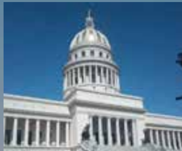
En la construcción del Capitolio Nacional se emplearon materiales de excelente calidad, como mármoles italianos.