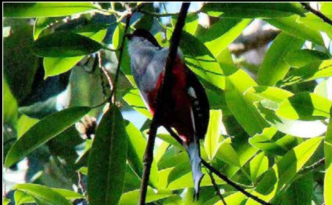
La naturaleza de las elevaciones cobija una gran biodiversidad.

En territorio, es el tercero de esta tipicidad en Cuba, solamente superado por la Sierra Maestra, en el oriente, y la occidental Cordillera de Guaniguanico.