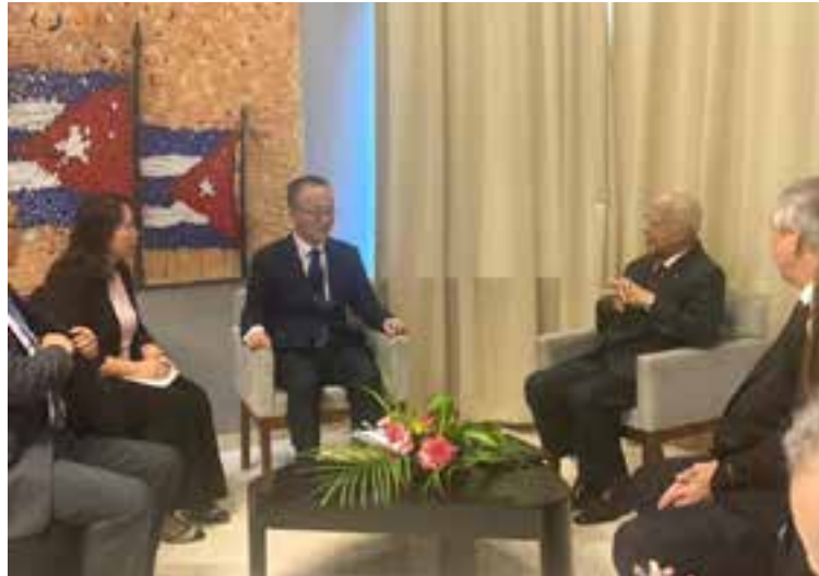
Ambas partes abogaron por seguir ampliando la colaboración en proyectos de ciencia, tecnología e innovación.

El 2 de septiembre de 1960, delante de más de un millón de cubanos, Fidel Castro instó a romper relaciones con el Gobierno de Taiwán para establecer vínculos diplomáticos con la República Popular China de Mao Zedong.