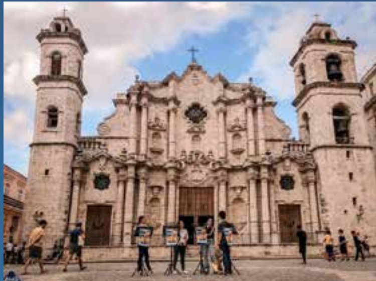
Varias reliquias y sagrarios posee la catedral, en cuyo interior se encuentran algunas tumbas de personajes ilustres de la ciudad y de Cuba.