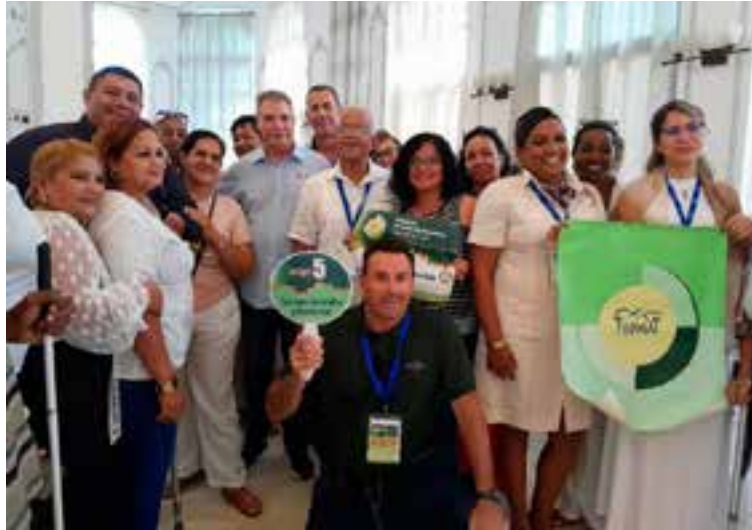
En la XIV edición de Turnat participaron alrededor de 130 especialistas, turoperadores y agentes de viajes, junto a periodistas del sector.

Al referirse a las modalidades incluidas en las visitas a las fincas agroecológicas, señaló que muestran el quehacer en los campos de Cuba, y destacó que los ministerios de Turismo y de la Agricultura,