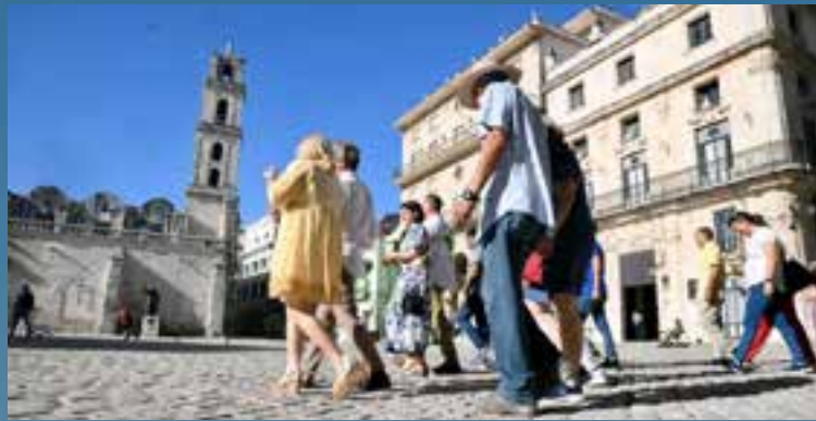
La urbe es el destino cultural más importante de la mayor de las Antillas.