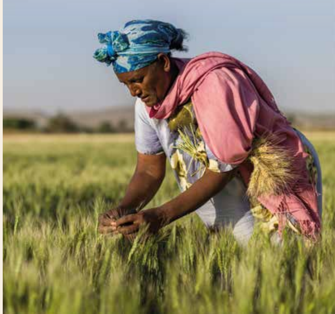
La agricultura y la industria manufacturera aportan al desarrollo nacional general.

La ministra remarcó que existen indicios de que el crecimiento económico de Etiopía volverá a alcanzar los dos dígitos. El desempeño de los últimos años, trabajos para solucionar cuellos de botella en la construcción, como el cemento y la puesta en funcionamiento de nuevas industrias, respaldan ese pronóstico. ■