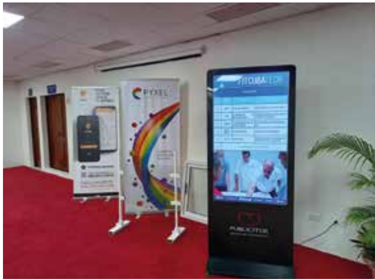
El recinto dispone de áreas para el montaje de exposiciones asociadas a los eventos.