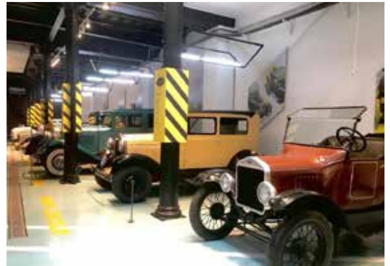
El Museo del Automóvil El Garaje ofrece una ventana única a parte de la historia del transporte cubano.