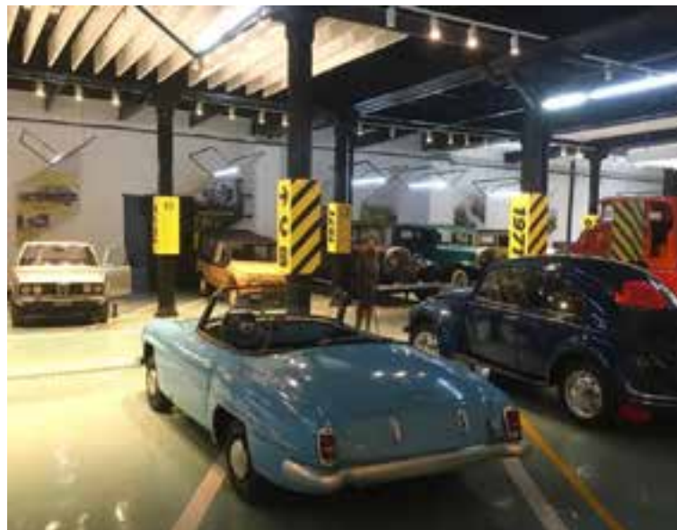
La instalación alberga impresionantes colecciones que datan de distintos periodos.

El espacio celebra una gran herencia automotriz y rinde homenaje a la inventiva del pueblo. Los mecánicos y propietarios han tenido que im-