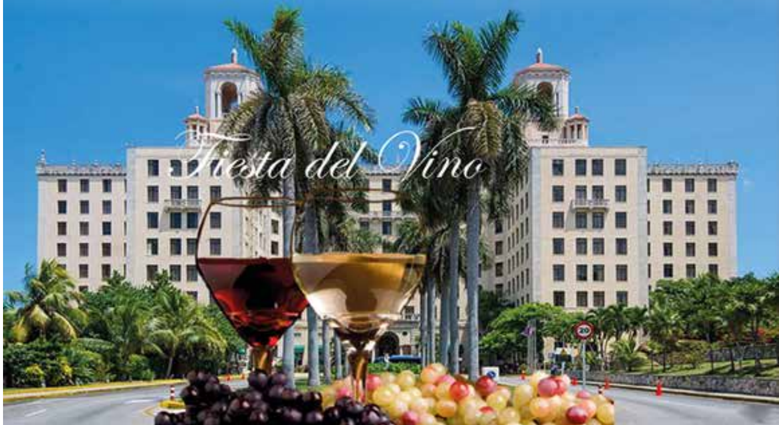
Una vez más, el Hotel Nacional de Cuba será la sede del evento.

Además de acoger la Fiesta Internacional del Vino, el hotel es centro de importantes celebraciones de relevancia mundial, como los festivales de jazz y el del Nuevo Cine Latinoamericano. ■