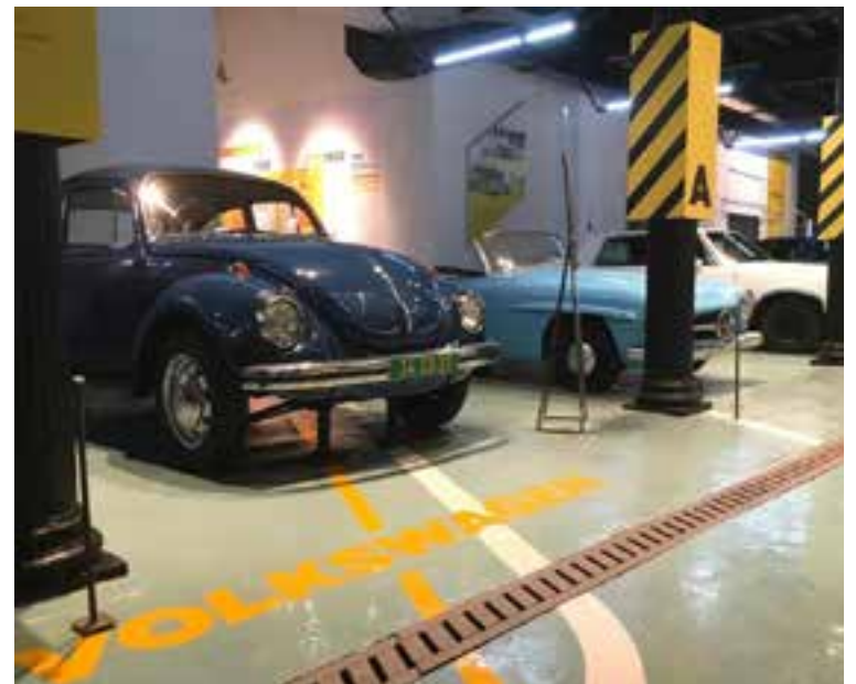
La mayoría de los vehículos exhibidos son piezas únicas.

La decoración de sus salas, que combina elementos modernos con detalles industriales, crea un ambiente que complementa de manera perfecta la temática. Para cualquier persona interesada en la ingeniería o simplemente en las fascinantes historias detrás de cada automóvil, ese museo deviene una parada obligatoria en la capital habanera. ■