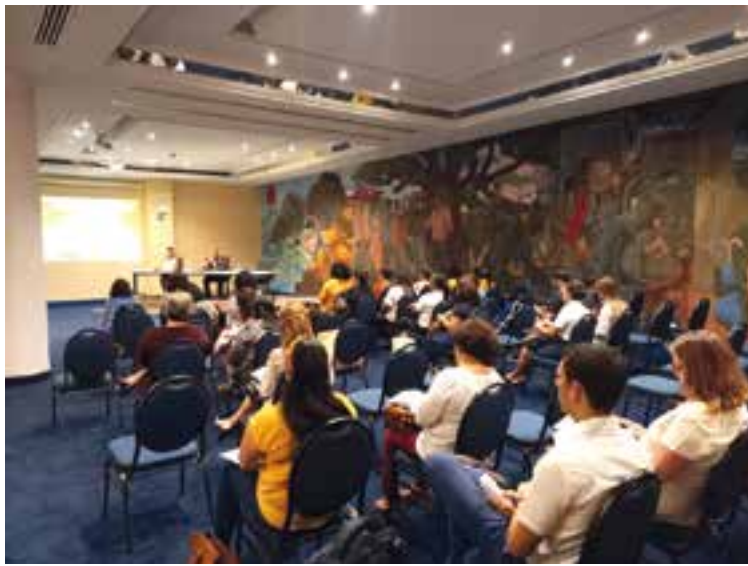
En 12 salones climatizados de diferentes formatos se ofrecen, entre otros, servicios de interpretación simultánea.