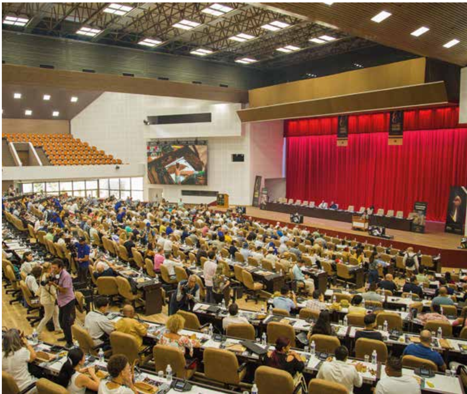
La instalación ha sido escenario de importantes acontecimientos nacionales e internacionales.