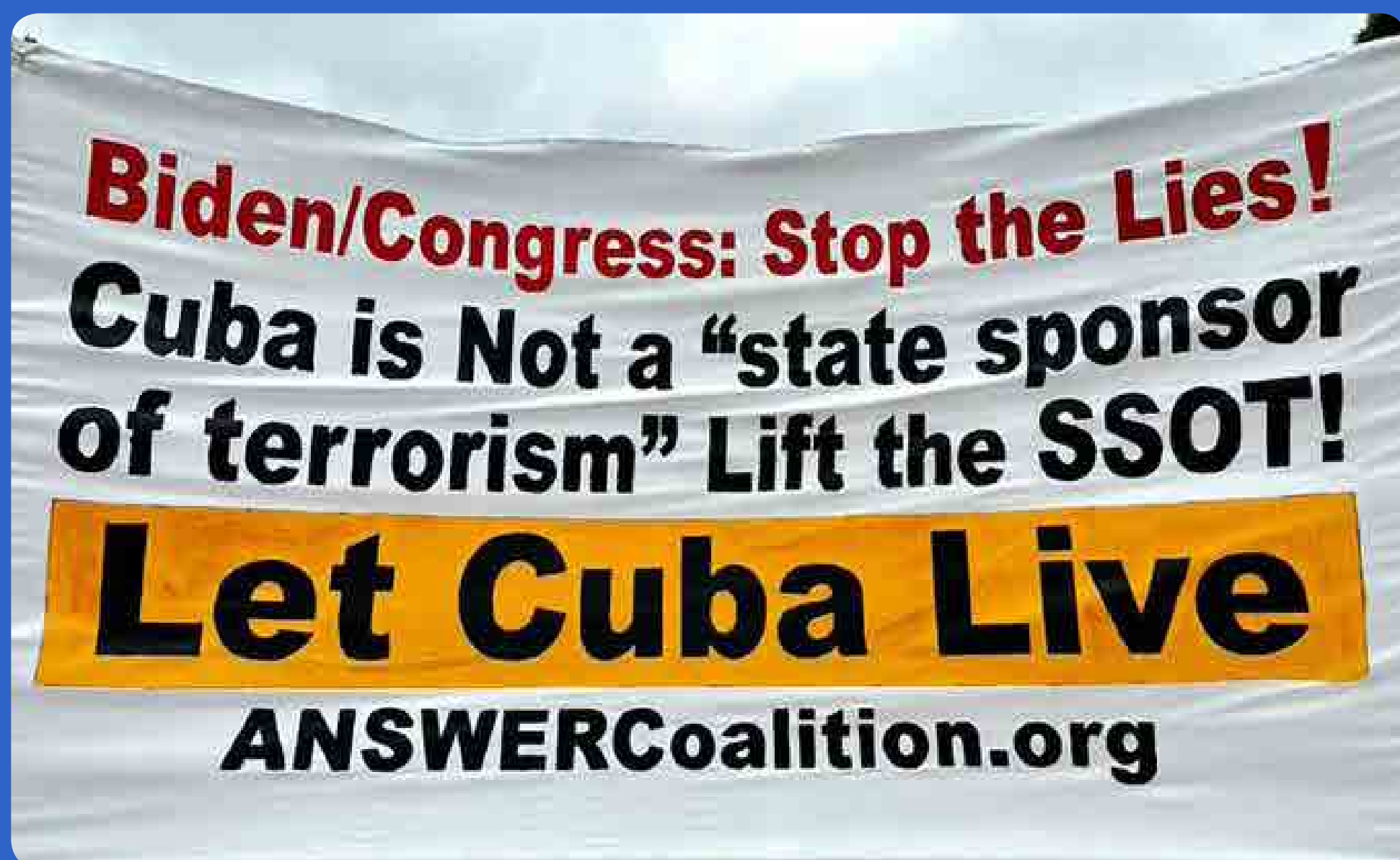
Intelectuales de todo el mundo respaldan misiva sobre Cuba de Ignacio Ramonet, al presidente Joe Biden.

Además, exige el fin del bloqueo económico, comercial y financiero impuesto por Washington a la isla desde hace más de seis décadas. ≡