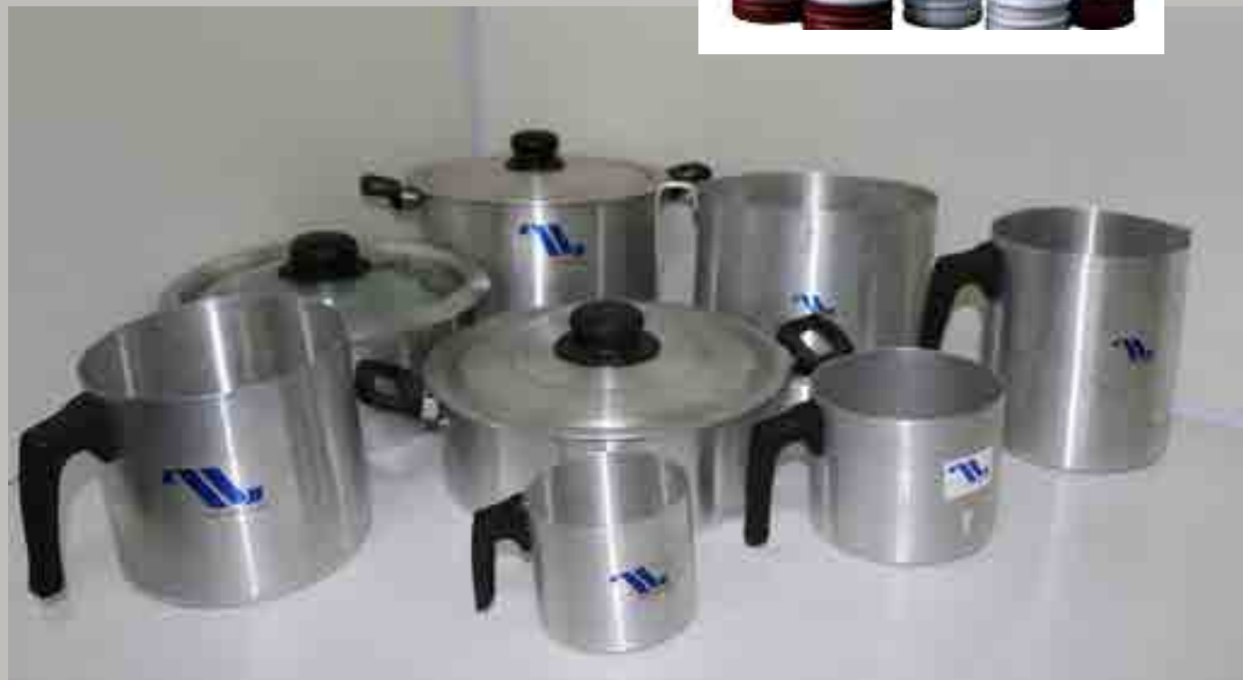
Las producciones son elaboradas con aluminio, hojalata y acero.

Como parte del encadenamiento productivo con enti-