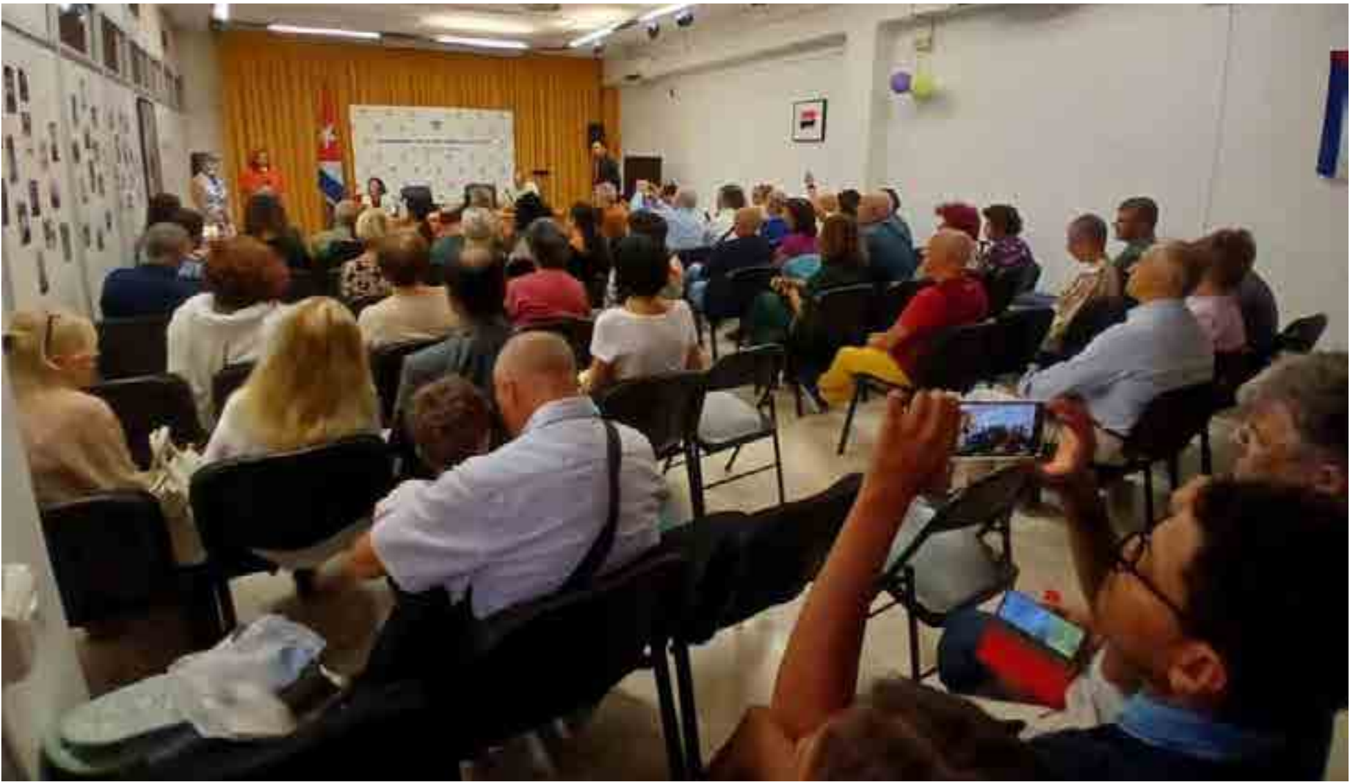
La cita contó con un amplio número de integrantes de la comunidad cubana en Italia.

integración entre los dos pueblos”, manifestó Granda.