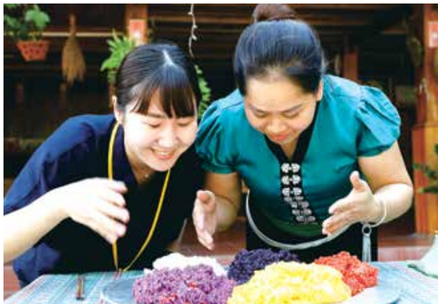
El sabor natural del arroz glutinoso de cinco colores resulta atractivo para todos.

El rojo representa el deseo de vivir y los sueños de un futuro brillante. El morado y el negro simbolizan la tierra fértil, que este pueblo considera un recurso precioso que necesita ser preservado y desarrollado. El amarillo significa prosperidad y el blanco el amor puro, la lealtad y el respeto a los progenitores ●