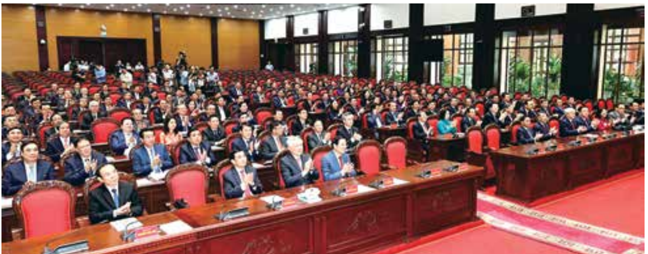
Reunión del Comité Central del Partido Comunista de Vietnam (PCV) del XIII mandato, celebrada en Hanói el 3 de agosto de 2024.