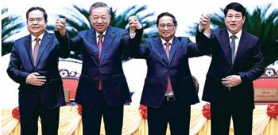
El secretario general del Partido Comunista y presidente de Vietnam, To Lam, el primer ministro, Pham Minh Chinh, el presidente de la Asamblea Nacional, Tran Thanh Man, y el miembro permanente del Secretariado del Comité Central del PCV, Luong Cuong.

Con el 100% de los votos a favor, el miembro del Buró Político y presidente de Vietnam, To Lam, fue elegido secretario general del Comité Central del Partido Comunista de Vietnam (PCV) del XIII mandato ●