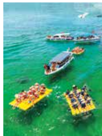
Actividades de team-building para los turistas en la isla de May Rut Trong (Phu Quoc).