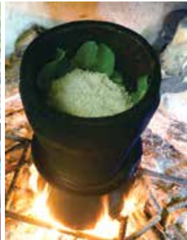
Después de teñir el arroz con plantas naturales, los thai de Muong Lo combinan los cinco colores del grano en cestas de madera.

E l arroz glutinoso de cinco colores no solo representa la cultura culinaria de la tierra de Muong Lo, sino que también tiene un sentido especial en la perspectiva y el pensamiento de los thai, que es la “teoría de los cinco elementos”.