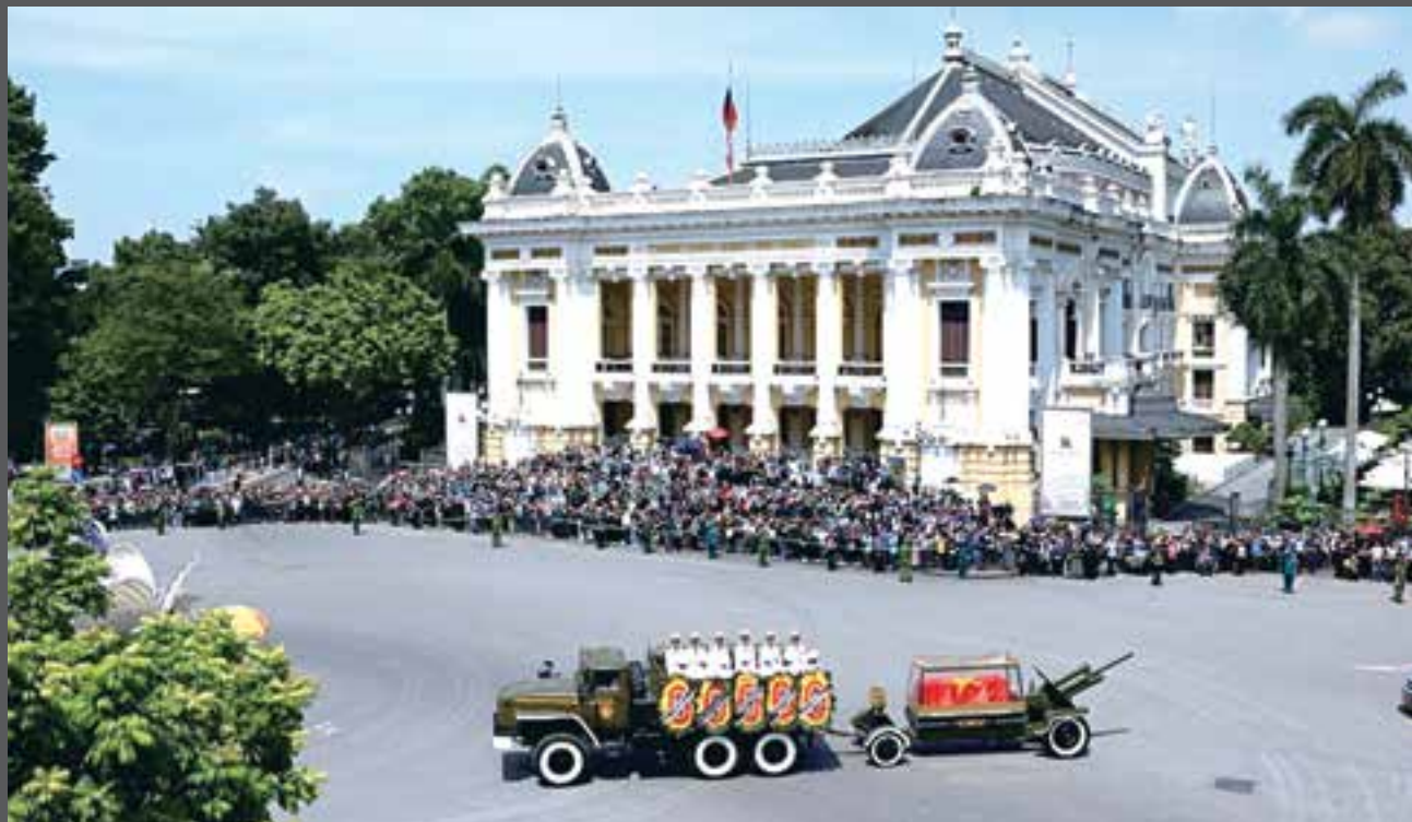
El 26 de julio de 2024, multitudes de residentes capitalinos se alinearon en las calles para despedir al secretario general del Partido, Nguyen Phu Trong.