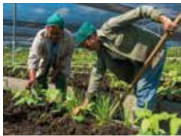
La iniciativa contempla la elaboración de vacunas, agricultura, producción de alimentos y economía circular.

la base de un progreso industrial inclusivo y sostenible, la creación de prosperidad compartida, la competitividad económica, la protección del medioambiente, y de fortalecer los conocimientos y las instituciones.