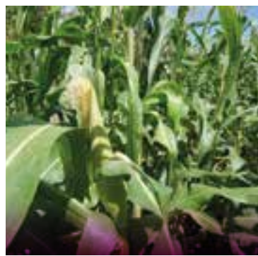
La fabricación de esos surtidos juega un papel estratégico, pues permite elevar rendimientos agrícolas.

Con financiamiento de la Unión Europea, abundó, la iniciativa busca mejorar las capacidades de producción, la calidad y el suministro estable