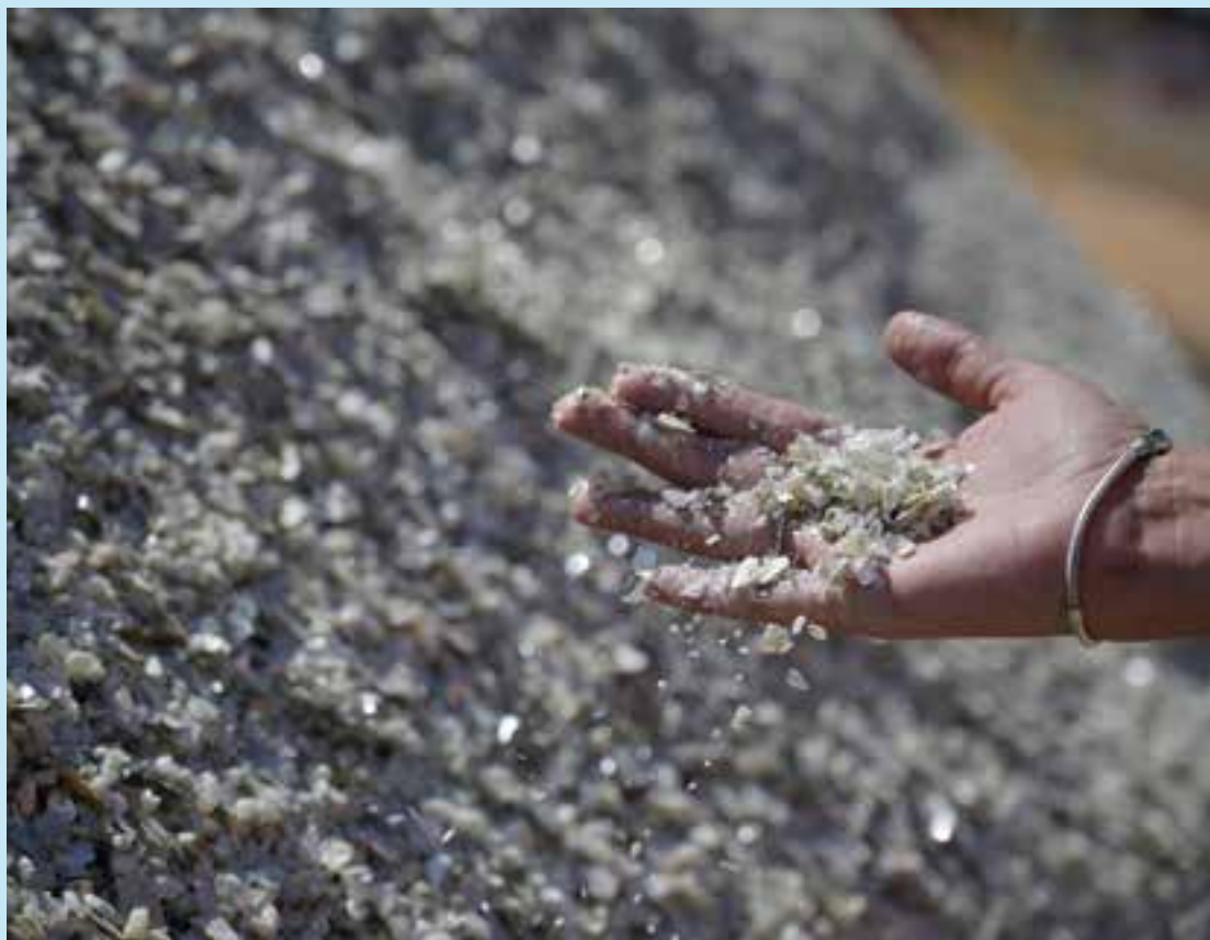
Muchos países con abundante dotación de minerales esenciales carecen de las capacidades de procesamiento.

En cualesquiera de los escenarios probables, las demandas futuras serán de consideración. La Conferencia de las Naciones Unidas