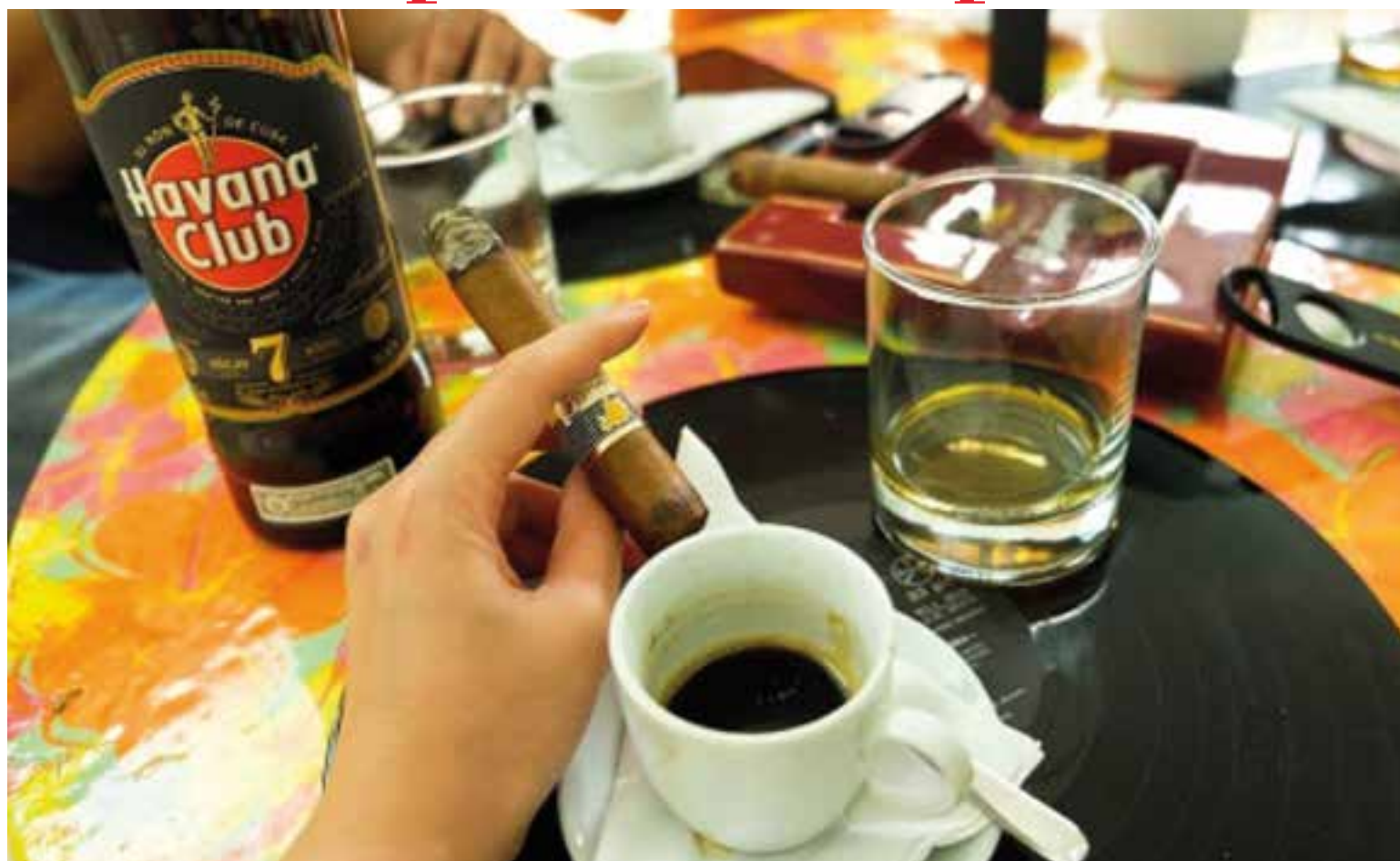
La cita es una oportunidad para aprender, descubrir, consumir y disfrutar las delicias de tres rubros típicos de la isla: café, tabaco y ron.

Dentro del programa habrá espacios para intercambios,