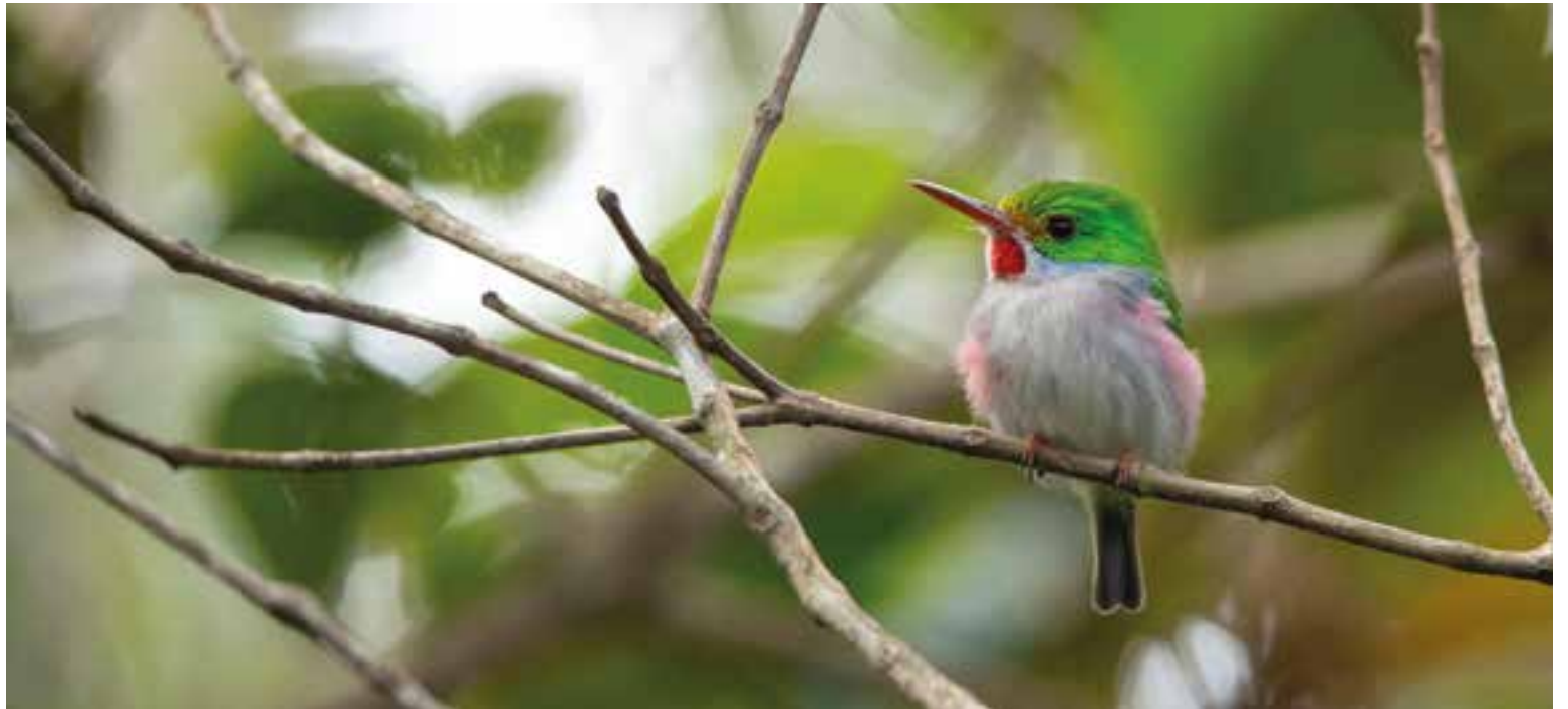
La zona alberga la mayor cantidad de plantas y animales autóctonos del Caribe.

Los ríos que fluyen, como el Toa y el Nibujón, resultan vitales para los ecosistemas locales, pues acogen diferentes vertebrados.