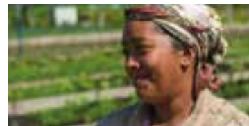
Las nuevas opciones de trabajo ofrecerán a las féminas la posibilidad de obtener ingresos económicos de manera inmediata y sostenida en el tiempo.

El proyecto, precisó, aportará en una primera etapa herramientas que facilitan la resinación, entre ellas, barrasco, media luna, mazo, escoda o azuela, varal, trazador; así como insumos para la recolección, por ejemplo, potes de plástico, clavos, martillos y escaleras.