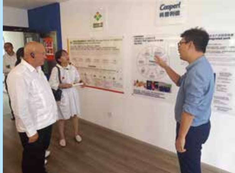
El vice primer ministro de Cuba Jorge Luis Tapia, visitó varias empresas y centros avícolas y porcinos de China.

El sector agroalimentario –recordó Tapia– fue defini-