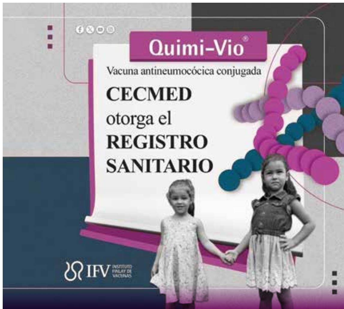
El inyectable resguardará a los menores de un año de 11 serotipos que producen la enfermedad neumocócica.