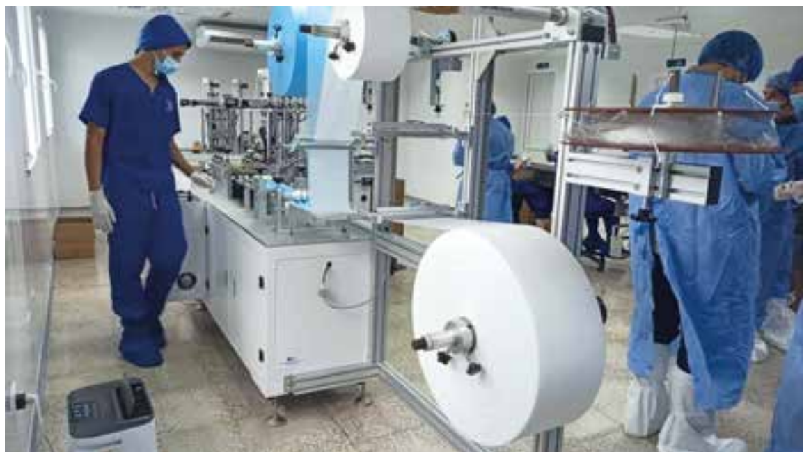
La cartera de propuestas abarca el desarrollo de tecnologías, polos de innovación, gestión del conocimiento en robótica e inteligencia artificial.

Recordó que en mayo pasado el director general de la Onudi, Gerd Müller, estuvo en el país y reafirmó el compromiso del organismo global con la isla. ■