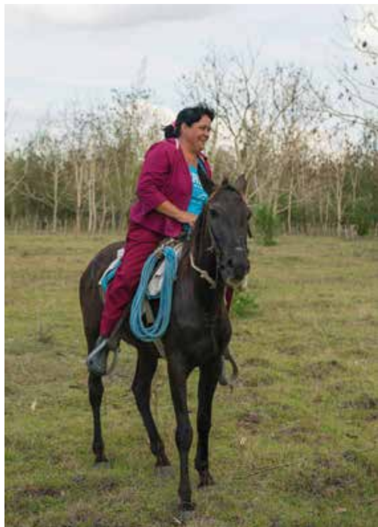
El proyecto Resiliencia Climática en los Ecosistemas Agrícolas de Cuba busca potenciar la participación de ellas en sectores tradicionalmente dominados por hombres.