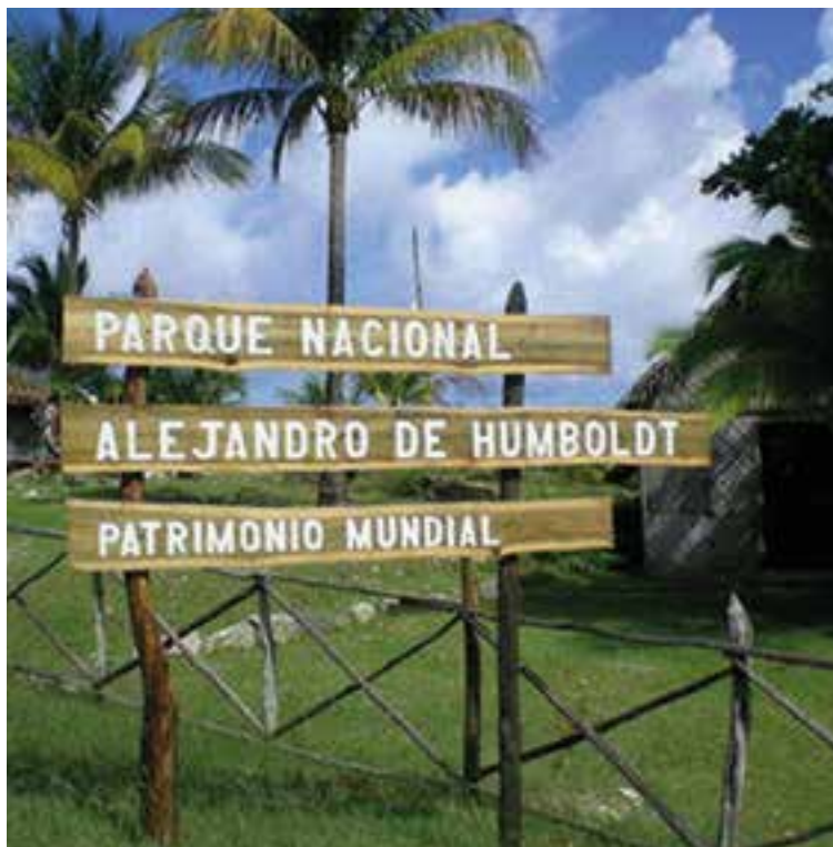
En el año 2001 el sitio fue declarado Patrimonio de la Humanidad por la Organización de las Naciones Unidas para la Educación, la Ciencia y la Cultura.