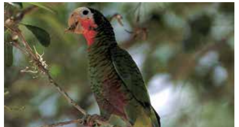
El Parque es reconocido por su excepcional valor ecológico y la asombrosa variedad de especies endémicas de la flora y la fauna.

Además, la variedad de microclimas, que van desde húmedos bosques tropicales hasta áreas secas, permite la coexistencia de una amplia gama de grupos adaptados a diversas condiciones ambientales.