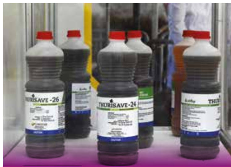
Entre las prioridades figura el fortalecimiento de la cadena de producción de diferentes formulaciones.

Según anunció la FAO, ello contempla la entrega al país de insumos de laboratorio, equipos de climatización, balanzas, molinos, destiladores de agua, kits de muestreo de campo, autoclaves y otros bienes.