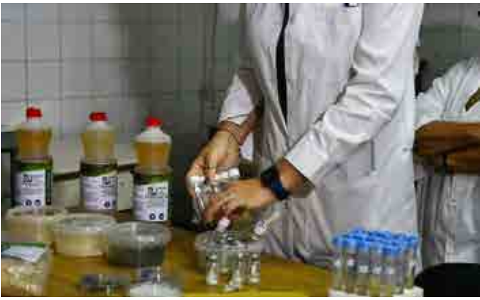
Entre las prioridades figura el fortalecimiento de la cadena de producción de diferentes formulaciones.