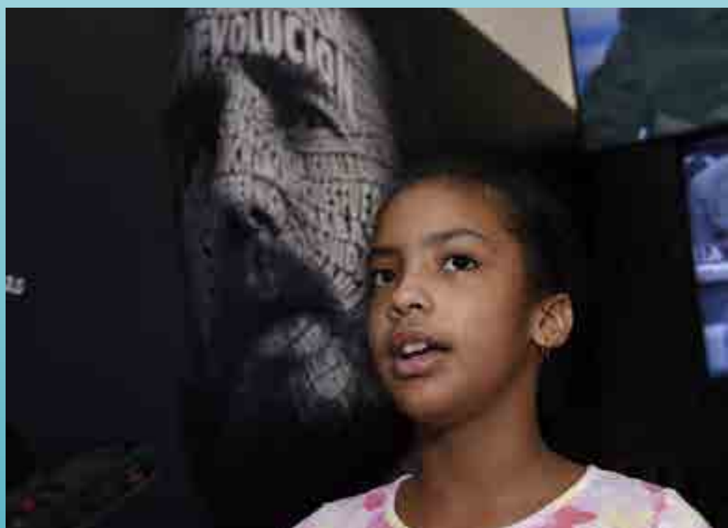
Entre sus objetivos fundamentales se encuentra mantener vivo el legado del líder histórico de la Revolución cubana.