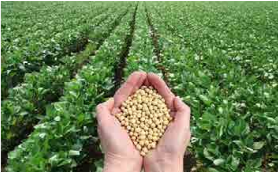
La fabricación de esos surtidos juega un papel estratégico, pues permite elevar rendimientos agrícolas.