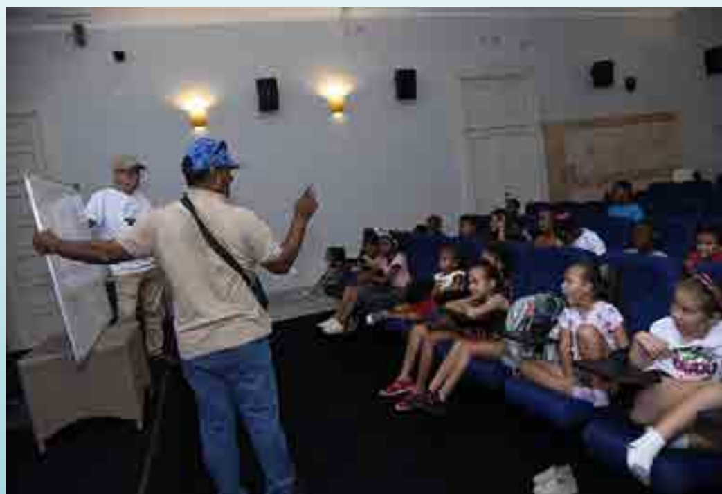
El público de la mayoría de las actividades son los niños, adolescentes y jóvenes, a quienes van dirigidos los talleres de verano.