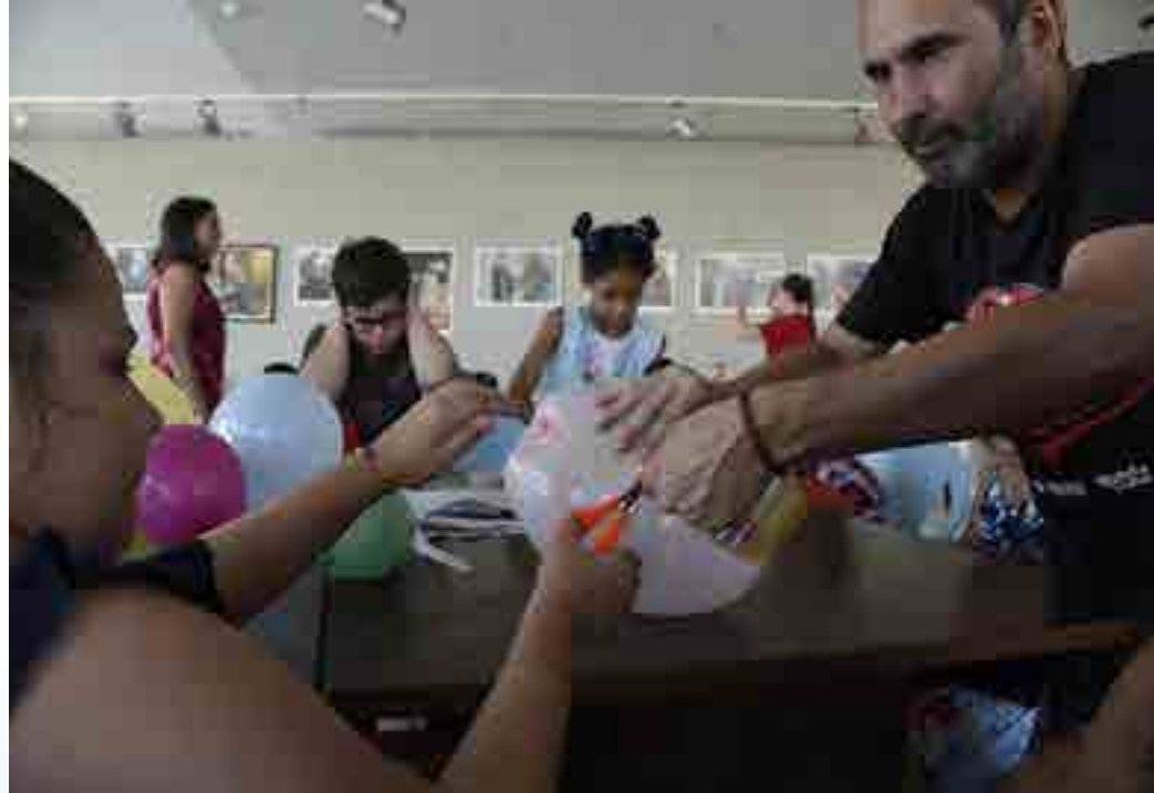
El Centro Fidel Castro Ruz, inaugurado el 25 de noviembre de 2021, transcurre siempre de manera muy dinámica, donde se ofrecen recorridos guiados a los visitantes nacionales y extranjeros.

Para mí lo más importante de estos talleres, que comenzaron el pasado 8 de agosto y se mantendrán durante todo este mes, es poder transmitir valores e inculcar a los niños principios como los de solidaridad y compañerismo para que sean personas de bien como soñaba Fidel, recalcó Espinosa. ≡