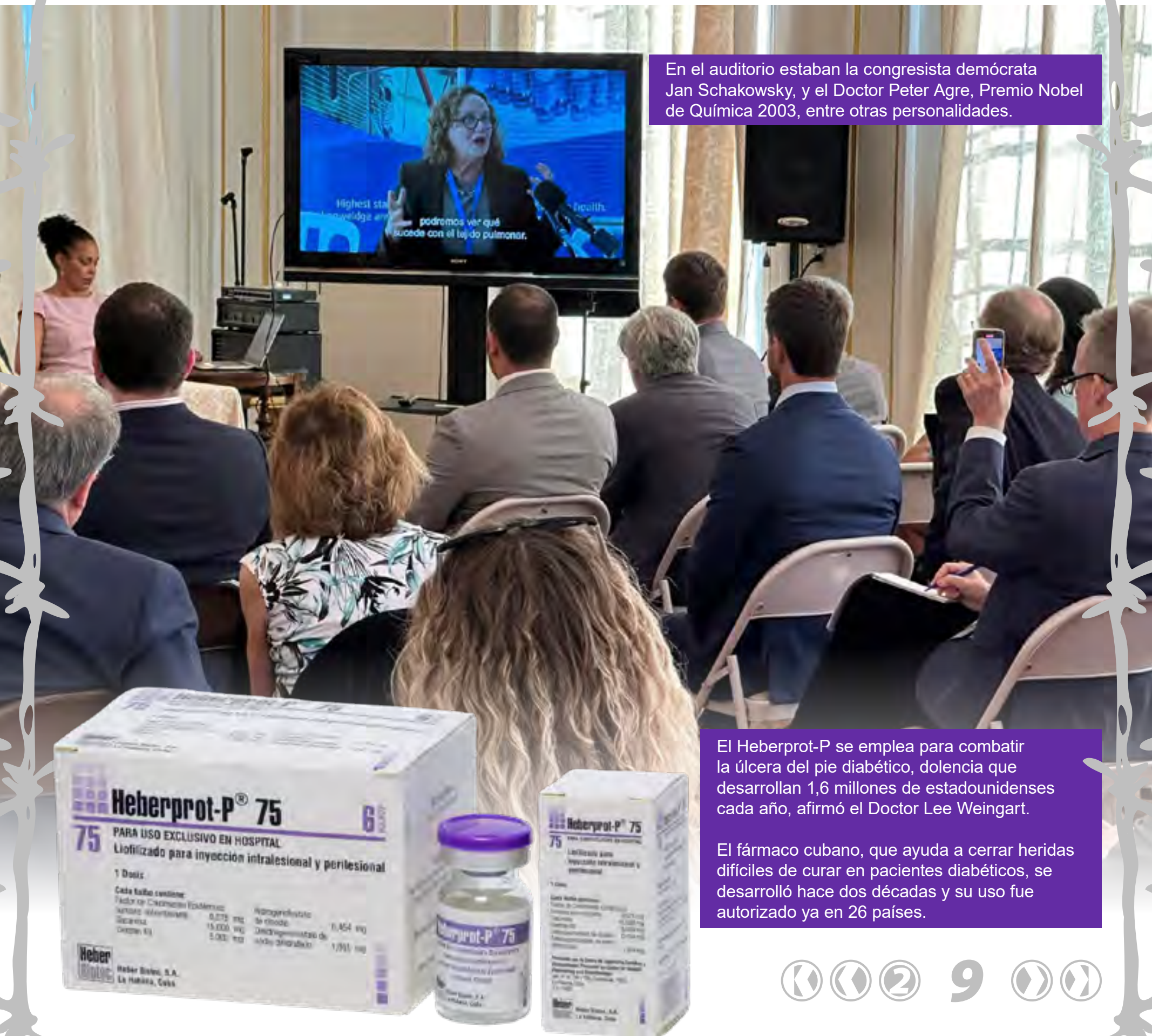
En el auditorio estaban la congresista demócrata Jan Schakowsky, y el Doctor Peter Agre, Premio Nobel de Química 2003, entre otras personalidades.

En 2022, el RPCI se convirtió en el primero en obtener la autorización de la FDA para ensayos clínicos en Estados Unidos con terapia cubana. ≡