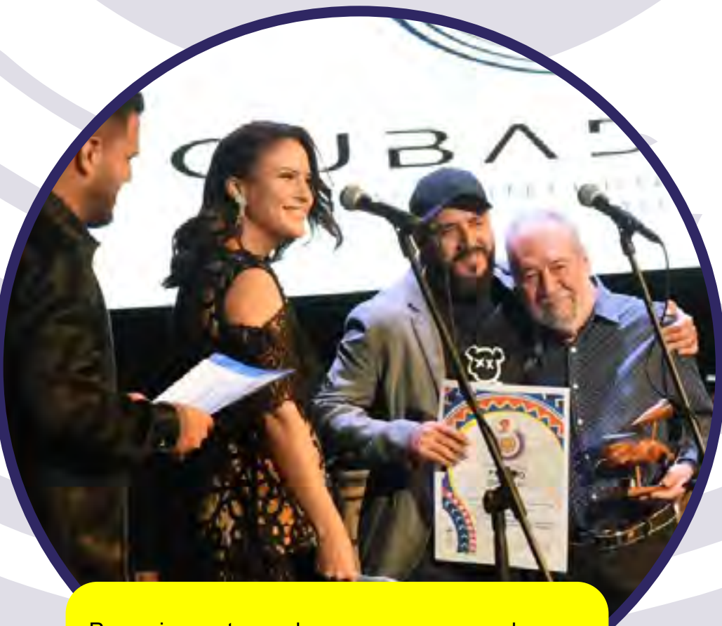
Por su impronta en el panorama sonoro cubano, se reconoció con Premios Especiales a la Orquesta Típica Original de Manzanillo.