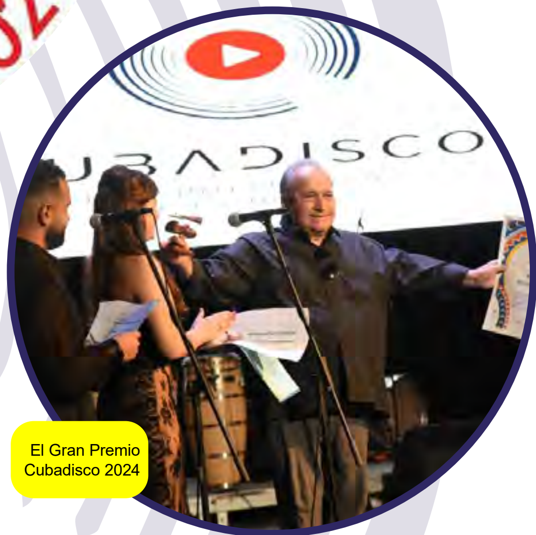
El Gran Premio Cubadisco 2024