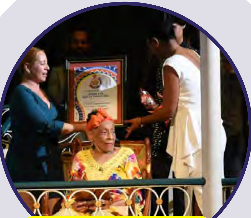
La diva del Buena Vista Social Club, Omara Portuondo, recibió el Premio a la obra de toda la vida, con el fonograma Vida .

Por su impronta en el panorama sonoro cubano, se reconoció con Premios Especiales a la Orquesta Típica Original de Manzanillo, por Original de Manzanillo , de la Egrem. ≡