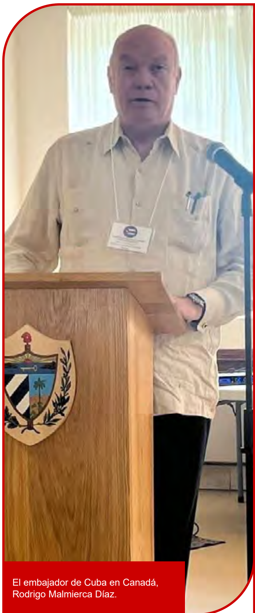
El embajador de Cuba en Canadá, Rodrigo Malmierca Díaz.