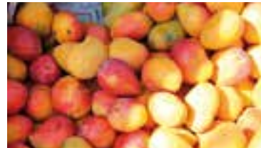
El propósito es reforzar las capacidades productivas de las entidades cooperativas.

La descentralización de las funciones y el problema de la alimentación en cada localidad es una responsabilidad del Gobierno, el Instituto aporta herramientas, expresó.