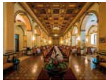
La mayor de las Antillas posee inmuebles y una amplia planta hotelera diseñada para el turismo de eventos.

El poder intercambiar con líderes y directivos del sector sobre tópicos relevantes asociados a la actividad en esta área geográfica constituye uno de los objetivos de la cita, que sesionará en uno de los destinos más importantes de la región.