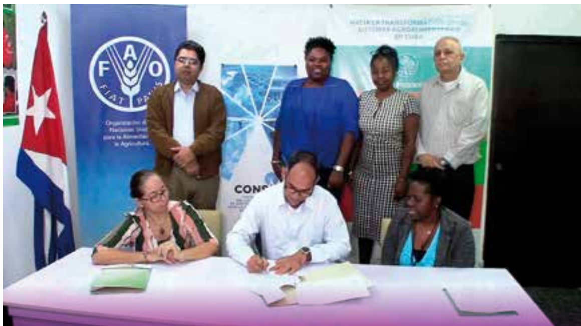
La iniciativa tendrá una repercusión directa en el manejo integrado de plagas en más de 5 000 hectáreas de tierras.