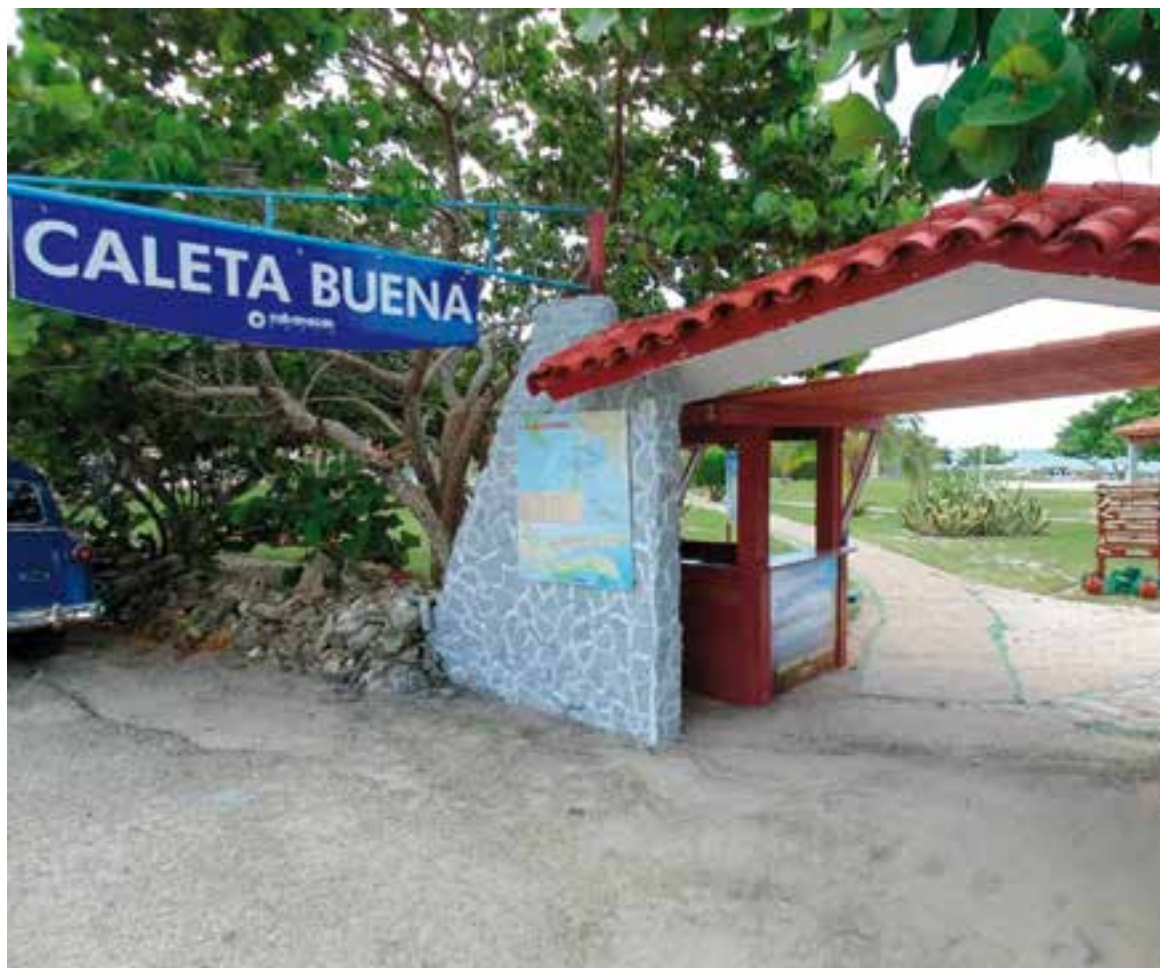
Uno de sus aspectos más destacados es el ambiente tranquilo.

Las suaves olas del mar y la brisa cálida crean una sensación de calma que envuelve y transporta a un estado de relajación total. ■