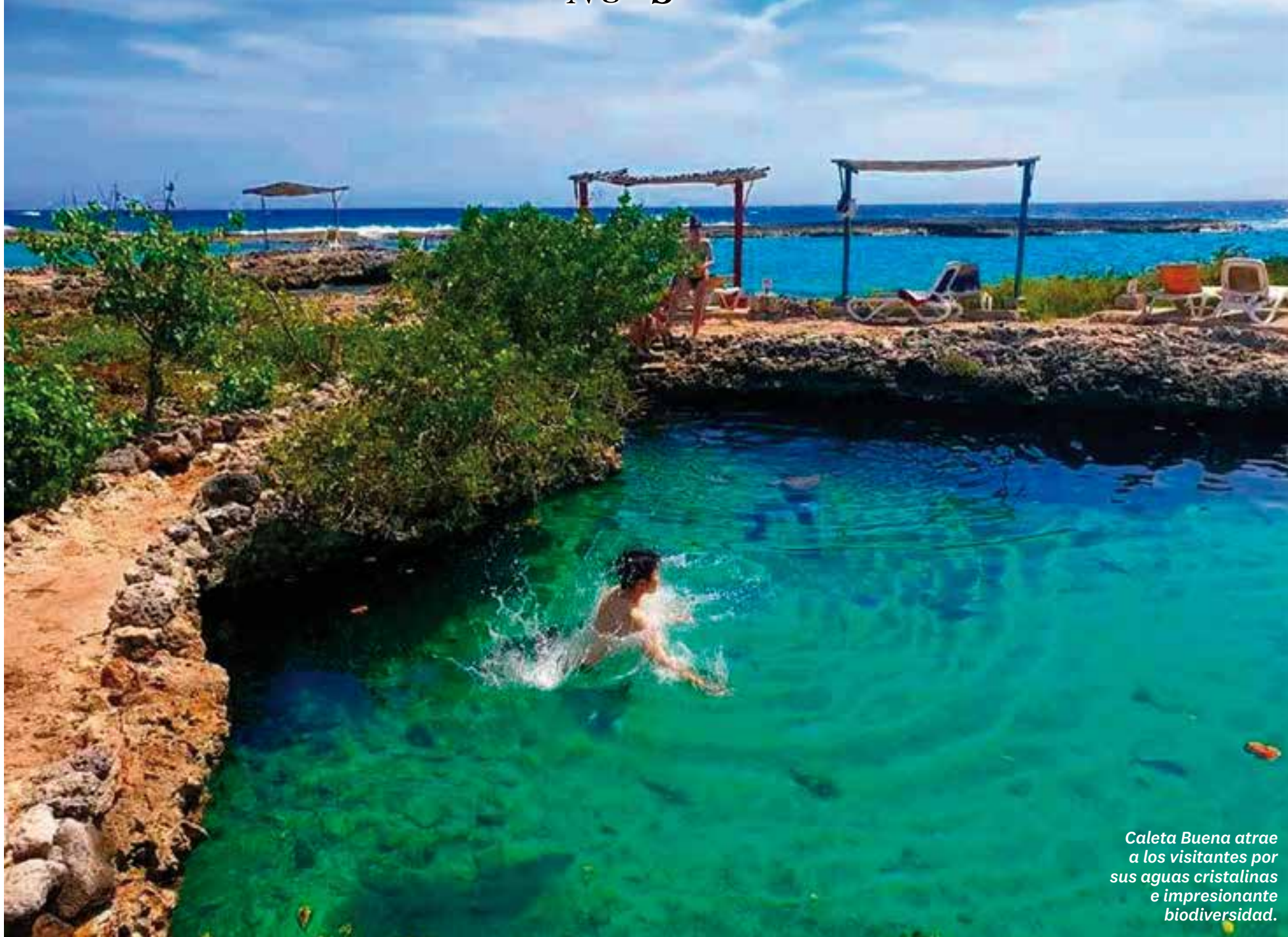
Caleta Buena atrae a los visitantes por sus aguas cristalinas e impresionante biodiversidad.