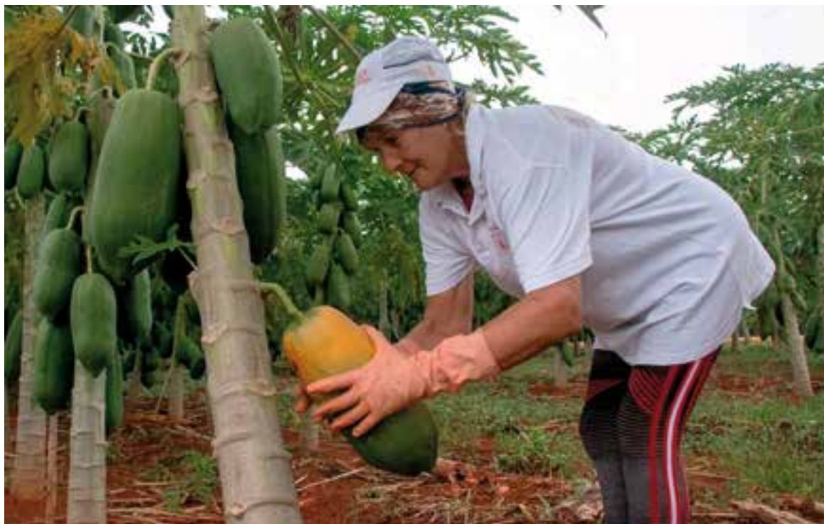
Existen aspectos transversales como la eliminación de brechas de género y el empoderamiento de las mujeres.

Farrés destacó que existen dos aspectos transversales en el proyecto: la eliminación de brechas de género y el empo-