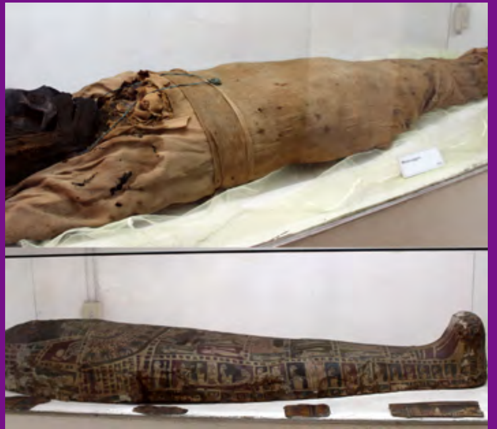
Única momia egipcia que se exhibe en Cuba.