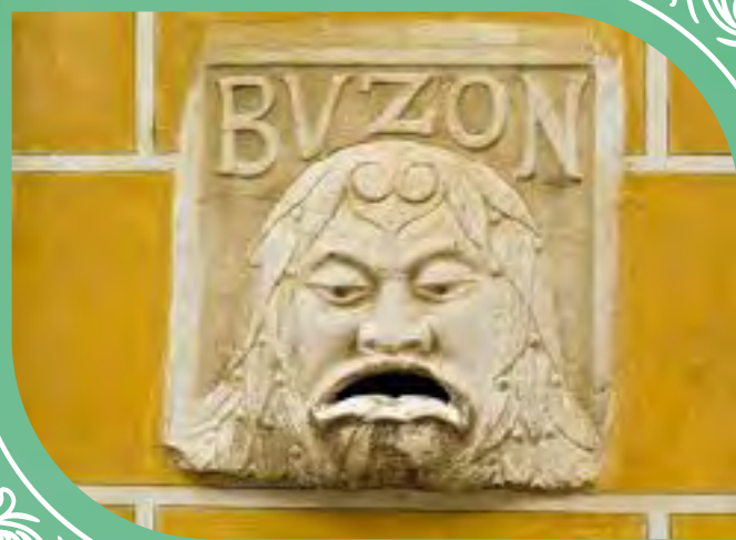
Buzón más antiguo de La Habana.

De ahí que los guías comenten a sus clientes ciertos elementos de una larga lista de curiosidades que sobre Cuba se pueden narrar. Algunos ejemplos son los siguientes: