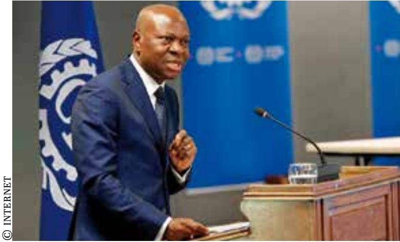
El director general de la OIT, Gilbert F. Houngbo, afirmó que "sin una mayor justicia social nunca tendremos una recuperación sostenible".

Para 2024 es de esperar que alrededor de dos millones más de personas busquen un puesto de trabajo, eso elevará la tasa de desempleo a 5,2 por ciento, frente al 5,1 por ciento registrado en 2023, pronosticó la entidad. ■