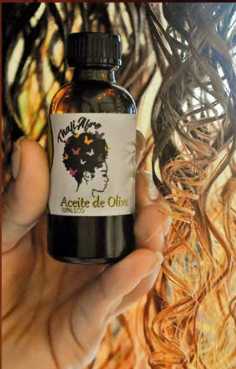
Las marcas existentes se multiplicaron, de cinco registradas y posicionadas, a más de 100 actualmente.