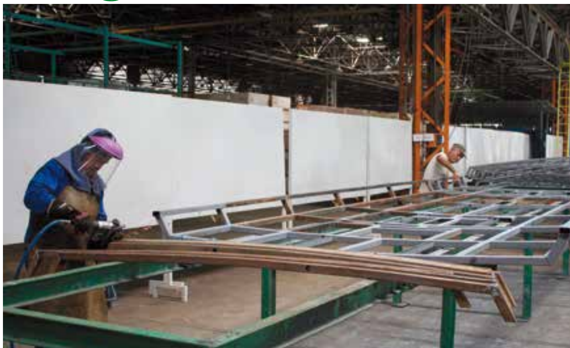
Incorporar paneles fotovoltaicos en escogidas y despalillos permitirá una mayor autonomía.