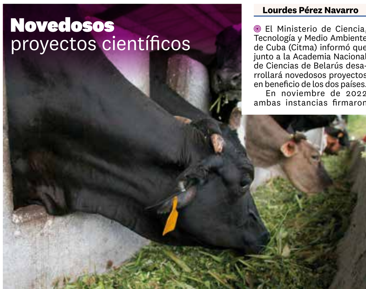
Las 18 iniciativas abarcan campos como la ganadería, agricultura, salud, botánica y cambio climático.

Entre los proyectos seleccionados sobresalen el análisis de la estructura genética de poblaciones de ganado Siboney, de Cuba, y la belarusa Holstein, y el desarrollo de un candidato vacunal de subunidad proteica contra el virus de la Peste Porcina Africana, así como su diagnóstico diferencial mediante el uso de técnicas de ingeniería genética. ■