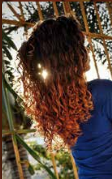
El aislamiento durante la pandemia posibilitó la apertura hacia nuevos públicos.

La coordinadora de Eco Rizos subrayó como elemento distintivo en la isla –en relación con los otros emprendimientos dentro del ecosistema–, que los nego-