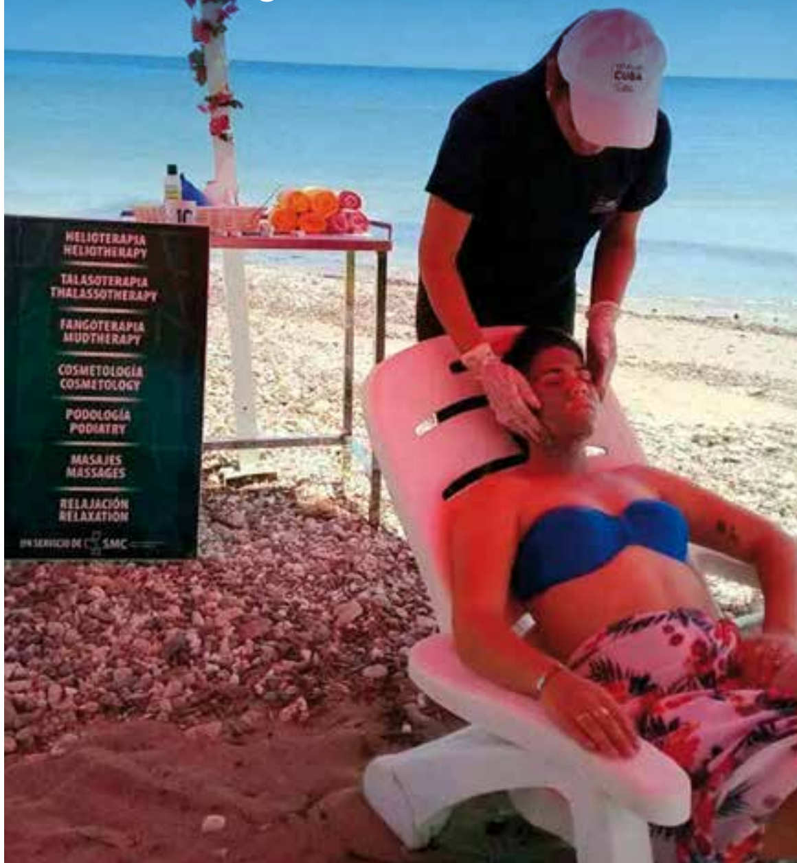
Las instalaciones hoteleras impulsan el empleo de energías ancestrales y la asesoría de especialistas.