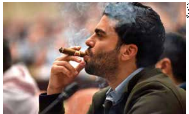
Aficionados, profesionales y expertos asistirán al evento.

Después llegó la cromolitografía sobre metal, lo cual concedió mayor distinción a los envases para seguir enriqueciendo la imagen de la preciada joya de la identidad isleña hasta la actualidad.