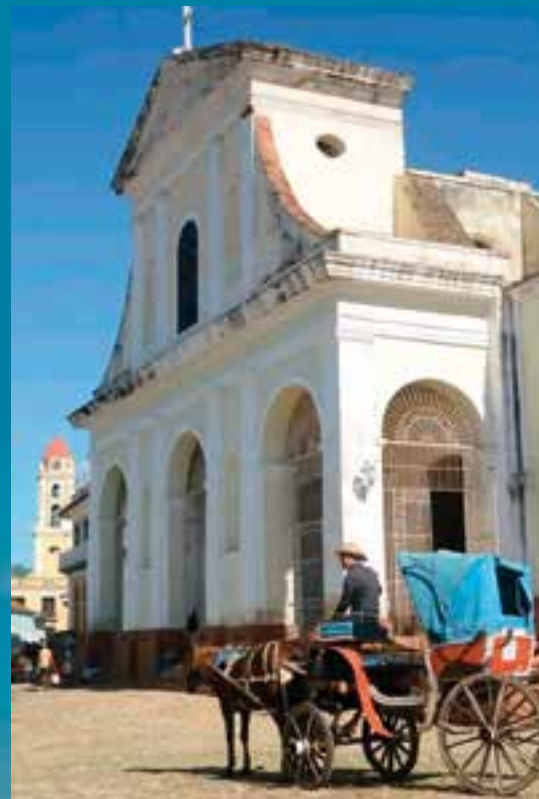
Existen inmuebles que denotan el esplendor y prosperidad de este lugar, declarado Patrimonio de la Humanidad por la Unesco en el año 1988.