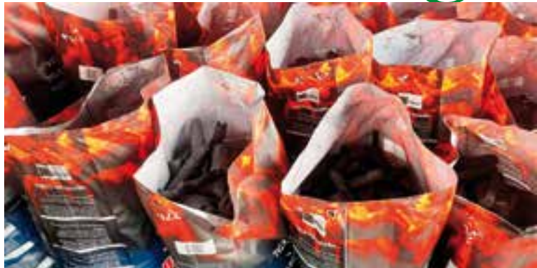
Uno de los aportes económicos más importantes proviene de la producción de carbón vegetal.