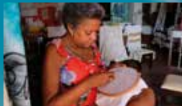
Para mantener vivas las tradiciones, ancianas y jóvenes bordan manteles y prendas de vestir.