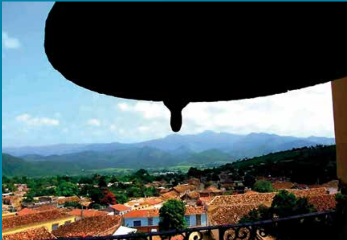
La urbe es considerada un museo a cielo abierto.

En conversación con Negocios en Cuba reconoció la alta representación de las edificaciones de los siglos pasados, los hermosos parques, las calles empedradas, los boquetes y las plazas de la tercera villa fundada por los españoles a orillas del río Guaurabo en 1514.