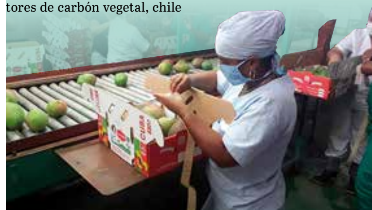
El territorio cuenta con una serie de rubros exportables consolidados y otros en fomento y desarrollo.