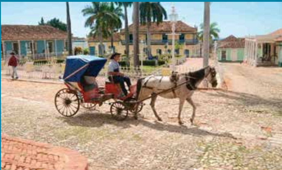
Posee un sistema de plazas y plazuelas que constituye uno de sus principales atractivos.

También se realizaron actividades artísticas, encuentros de artesanos, exposiciones y se reconoció a personalidades de la cultura y las artes plásticas. ■