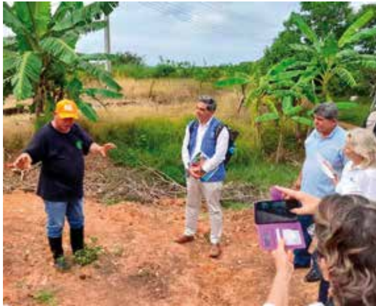
En medio de un contexto complejo, el Estado cubano focaliza sus recursos hacia los Objetivos de Desarrollo Sostenible.

“La mitad del año Cuba vive la temporada ciclónica y noso-