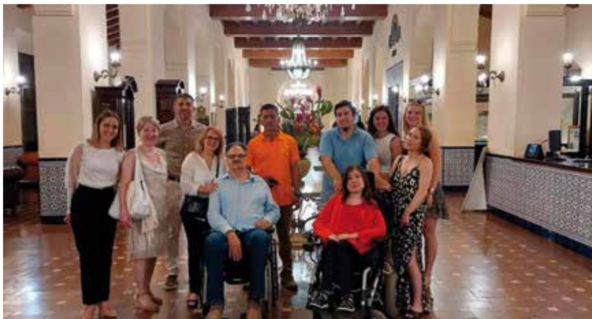
Muchas instalaciones cumplen con los requisitos más importantes, a la vez que deben sumarse otros polos importantes como Cienfuegos y Trinidad.