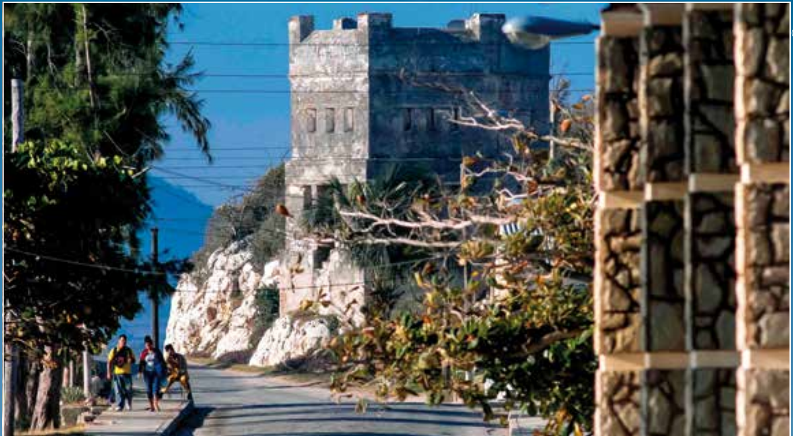
Gibara atesora muestras significativas del antiguo sistema defensivo colonial.

En cuanto a la preservación de construcciones de época se puede admirar la única casa señorial, perteneciente al ingenio azucarero del siglo XIX, que se mantiene en buen