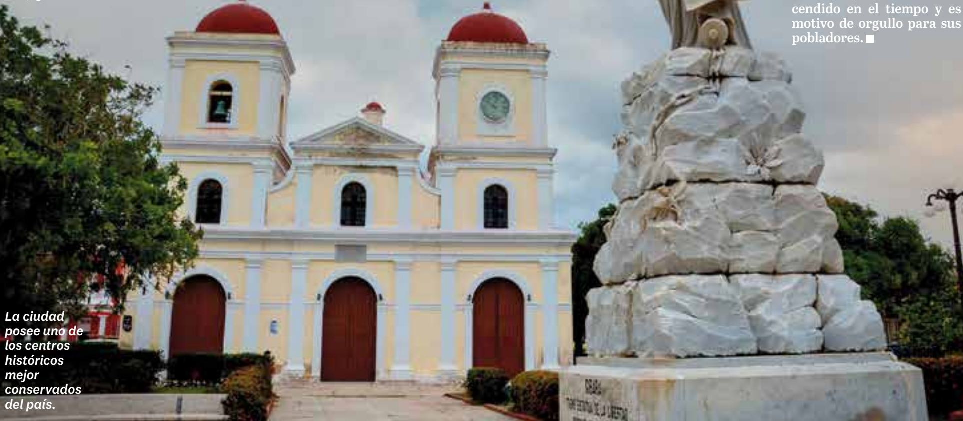
La ciudad posee uno de los centros históricos mejor conservados del país.

estado en toda la región: la Casona de Santa María.