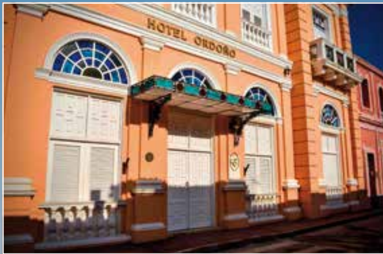
En el desarrollo del turismo ha influido la implementación de planes de rehabilitación de áreas urbanas y la creación de hoteles.