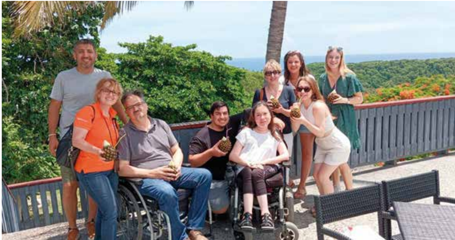
Turoperadores de varios países viajaron a la isla, interesados en conocer este destino para potenciar las vacaciones para los turistas con discapacidad o movilidad reducida.

González está convencido de que Cuba puede transformarse en un destino sumamente importante para tales viajes. De hecho, ya se realizan permanencias en lugares como La Habana, Viñales y el balneario de Varadero.