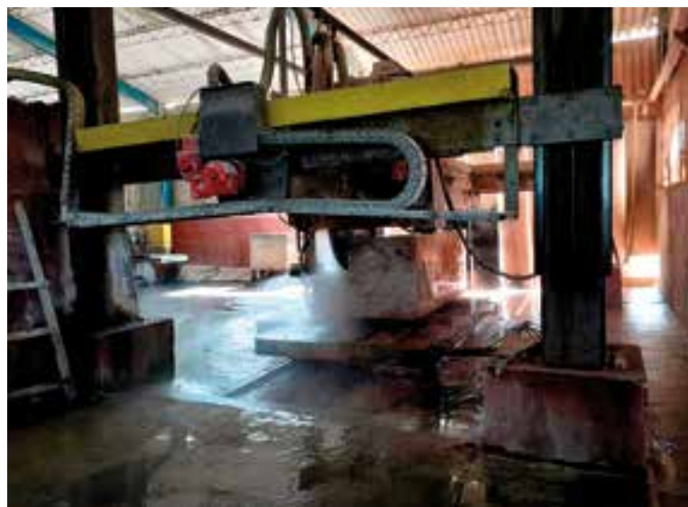
Los avances logrados son resultado de la adquisición en los últimos años de nuevos equipos y de las mejoras en el proceso industrial.

Pedro Pablo, con cerca de 70 años y vecino de la planta, reconoce que la gran cumbre cubierta de vegetación —muchos decían que era un mogo-