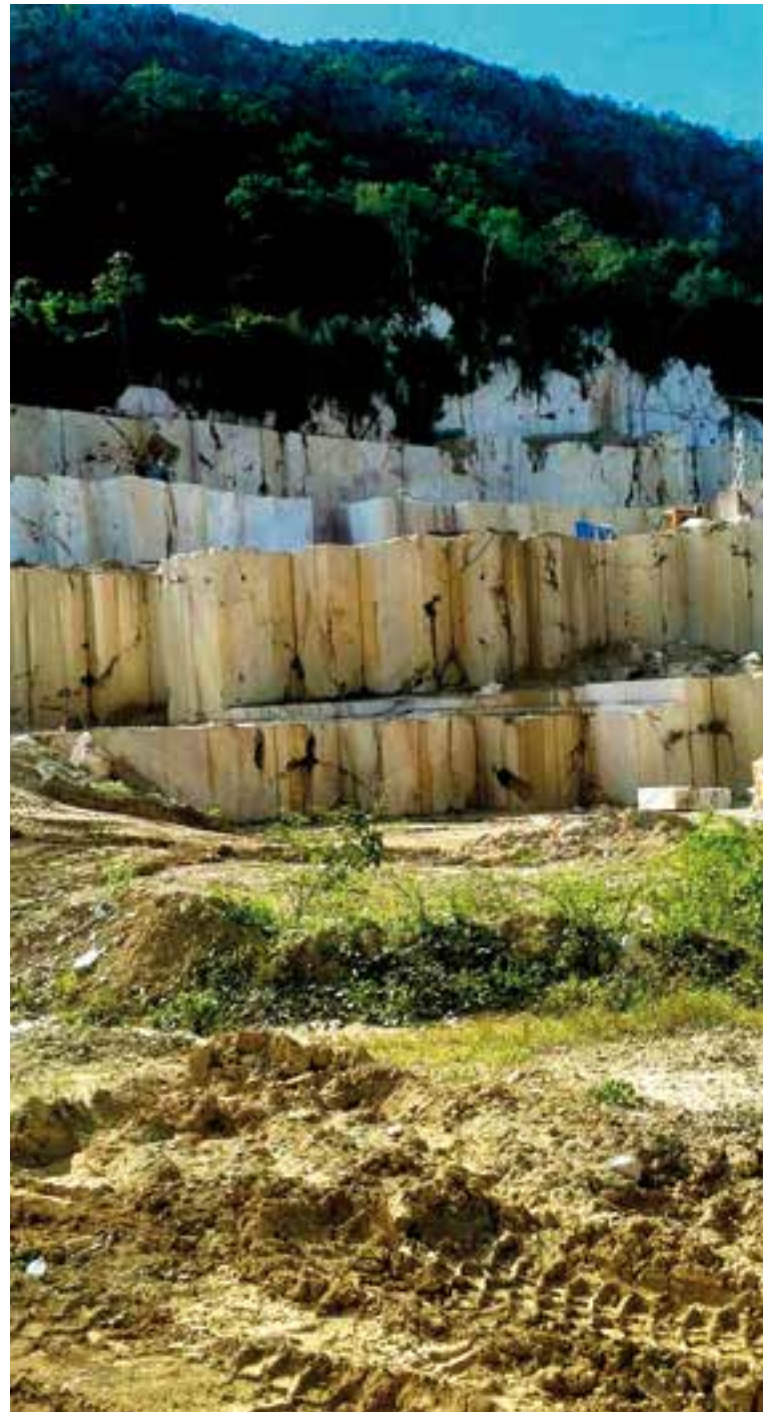
La montaña de mármol de Cariblanca forma parte de uno de los valles más hermosos del centro del país.

La montaña de mármol de Cariblanca forma parte de uno de los valles intramontanos más hermosos de esta zona central de Cuba, con reservas para seguir contribuyendo al desarrollo de la comunidad y a la restauración de otras zonas del país como la Habana Vieja. ■