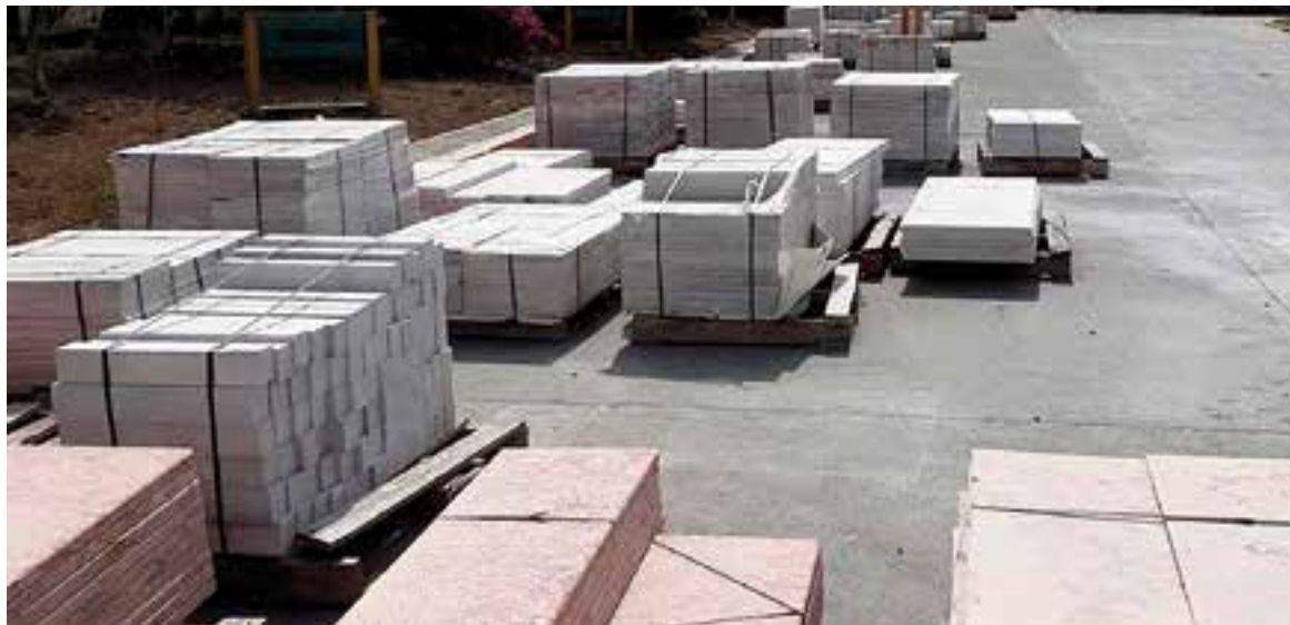
Las variedades Rojo Campiña y Crema Escambray se caracterizan por su dureza, lo que permite la elaboración de láminas más finas.