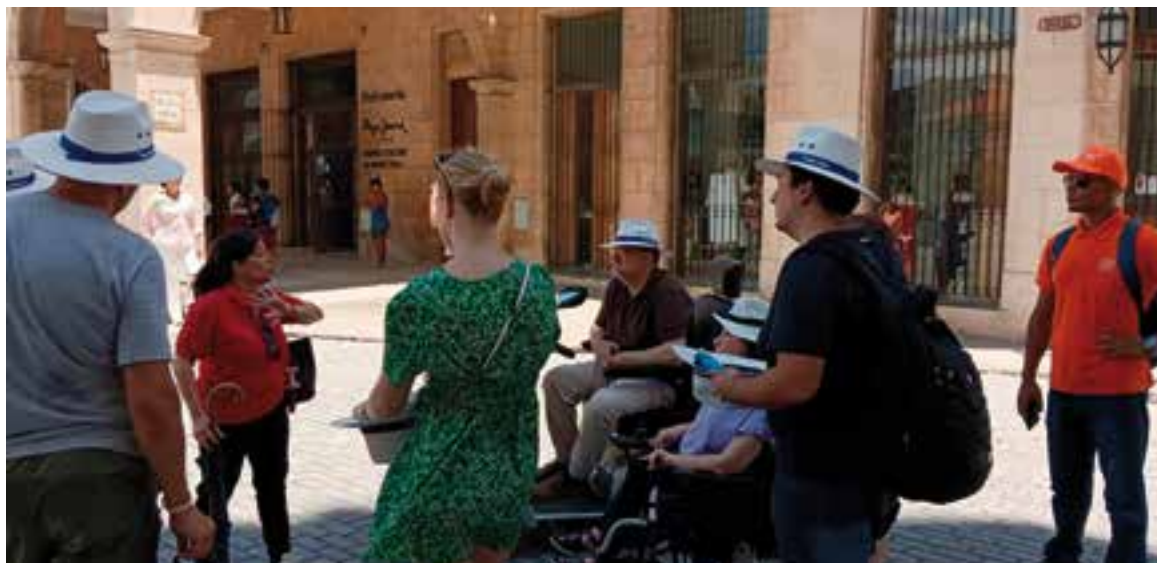
La visita de los especialistas permitió que se adentraran en la oferta extra-hoteler a fin de conocer sus posibilidades.

En el mencionado vuelo viajaron turoperadores de Países Bajos, Alemania y España, interesados en conocer este destino turístico para potenciar las vacaciones para este tipo de viajeros.