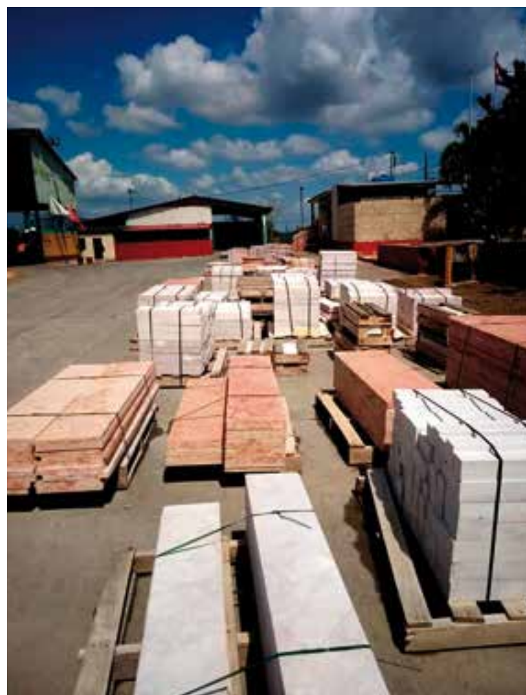
Algunos tipos de ese recurso tienen alta demanda para la construcción de proyectos turísticos, de salud y centros científicos.